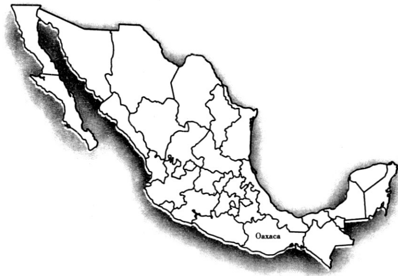
UBICACIÓN DEL ESTADO DE OAXACA

siones de tierras y continuaron arrendando las tierras a los pobladores asentados dentro de sus cacicazgos. Ciertamente el arrendamiento de las tierras del cacicazgo no presenta de suyo ningún problema para la propiedad liberal. Sin embargo, como veremos mas abajo, la población asentada dentro de los cacicazgos, reclamó sus derechos propios a una parte de esa propiedad. Por otra parte, los campesinos mixtecos encararon una lucha secular por hacerse de una propiedad propia. En el caso de la Mixteca, la institución del cacicazgo entró en crisis desde principios del siglo XVIII. Esta crisis se manifestó cuando varias poblaciones de terrazqueros (asentados en tierras del cacicazgo) buscaron independizarse de sus caciques fundando pueblos o repúblicas de indios independientes. Sin embargo, pocas poblaciones lograron liberarse de sus caciques.