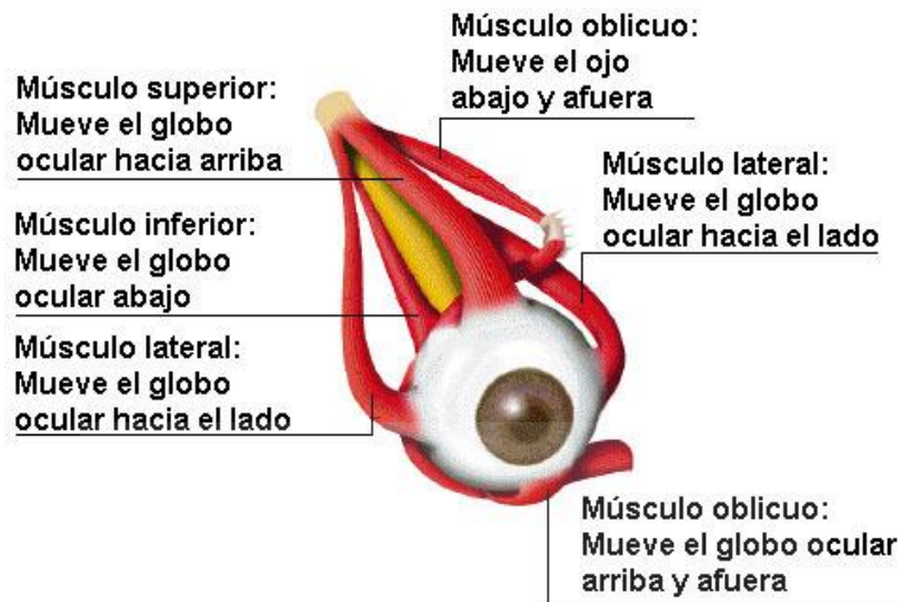
Fig 3 - Músculos del ojo.

Por último, como parte de la órbita ocular, podemos encontrar, las cejas, los párpados, la conjuntiva y el aparato lagrimal.