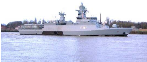
Gambar 2.2 kapal corvette

Korvet merupakan jenis kapal perang yang lebih kecil dari fregat dan lebih besar dari kapal patroli pantai, walaupun banyak desain terbaru yang menyamai fregat dalam ukuran dan tugas. Biasanya dimasukan kategori sebagai kapal patroli yang mampu melakukan operasi sergap dan serbu secara mandiri [4]