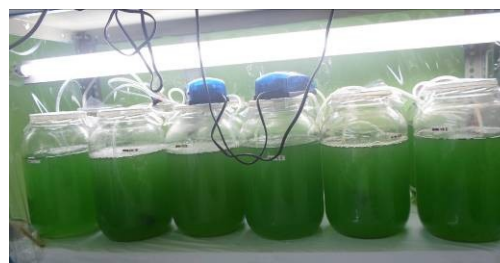
Gambar 9. Kultur Spirulina sp. pada masing masing perlakuan.