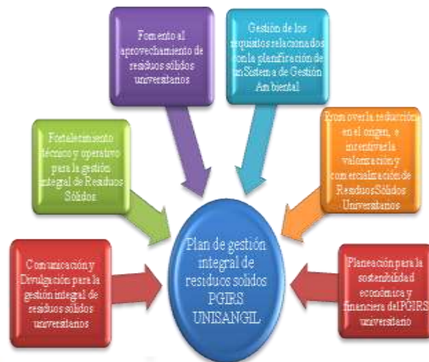
Fig. 1. Líneas estratégicas

Teniendo en cuenta lo anterior, mediante la evaluación realizada en la Matriz DOFA, se establecieron seis estrategias que permitieron formular planes, programas, proyectos y actividades que conlleven a la implementación del PGIRS universitario. En el siguiente gráfico se muestran las líneas estratégicas establecidas.