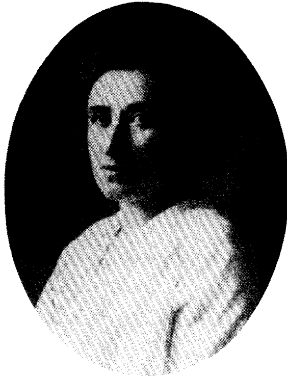
写真 ローザ・ルクセンブルクと 中京大学図書館所蔵図書