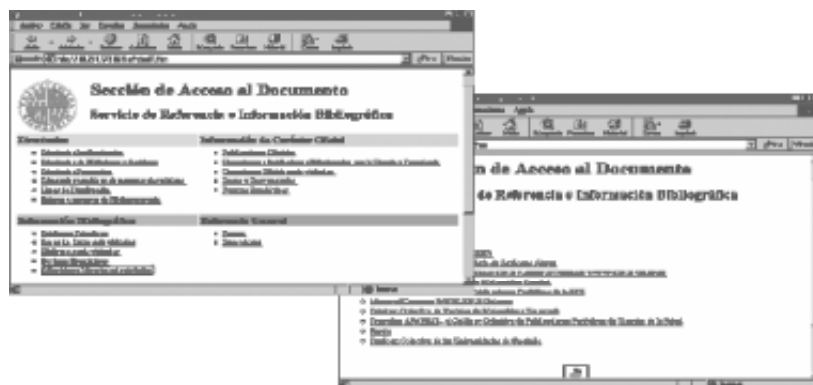
Figura 2 Aspecto Estético del DERIE

De forma más detallada en las Tablas II y III se puede observar la distribución por tipos de fuentes de los recursos. En cuanto a los tipos de recursos por categorías generales se observa que la mayoría de los recursos concentrados en las webs de las bibliotecas hacen referencias a recursos relativos a Información Bibliográfica (catálogos públicos de otras bibliotecas, bases de datos de recursos bibliográficos comerciales, etc.). Por otra parte también parece interesante como las referencias a los webs de otras bibliotecas son el primer tipo de recurso más coincidentes en todos los servidores, lo cual refuerza la idea de que para la construcción de DERIE la consulta de estos recursos en bibliotecas externas puede constituir una práctica en el momento de desarrollar uno concreto.