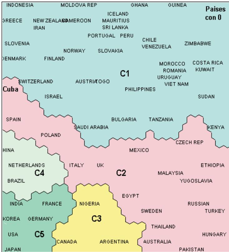
Figura 2. Distribución de la actividad científica por países según los años (1990-1999). Análisis de la soja en la alimentación humana