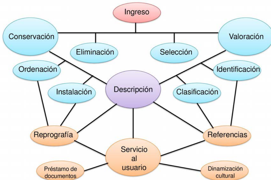
Figura 1. Mapa de procesos archivísticos

David Bearman y Richard Lytle (1985-1986) consideraron, como Hurlley, que la descripción archivística tiene que comenzar antes de que exista el propio documento (en el momento mismo de diseñar el sistema), y que debe ser reflejo de las funciones e interacciones que dan lugar a la documentación (Bearman y Lytle, 1985-1986). Los restantes procesos de gestión documental tienen que encarar la globalidad del contenido, estructura y contexto documental.