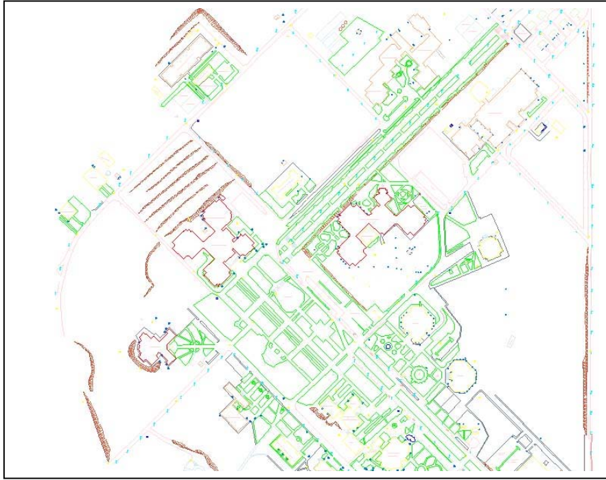
Şekil 3. Test alanı

Uygulama alanı olarak, Selçuk Üniversitesi Alaeddin Keykubat Kampusu seçilmiştir. Kampus alanı Konya şehir merkezine yaklaşık 20 km. uzaklıkta olup Konya-Afyon karayolu üzerindedir. Kampus alanında yapılaşma kısmen tamamlanmış, çevre düzenleme çalışmaları ise devam etmektedir. Çalışma alanı olarak, CBS oluşturulması için gerekli olan konumsal verilerin elde edilmesi ve karşılaştırmalarının yapılabilmesi için yaklaşık 20 hektarlık bir test alanı seçilmiştir ( Şekil 3).