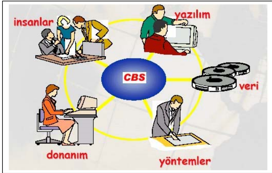
Şekil 1. Coğrafi Bilgi Sisteminin Bileşenleri

Grafik-Olmayan Bilgiler ise, genellikle grafik olmayan tanımlayıcı nitelikteki yazılı bilgiler olup, coğrafi varlıkların, öznelik bilgilerinden oluşur.