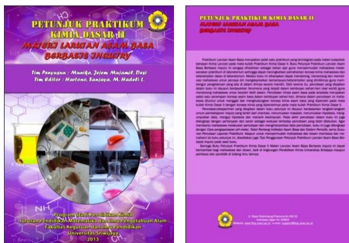
Gambar 2. Halaman Sampul Petunjuk Praktikum Larutan Asam Basa Berbasis Inquiry

pengembangan, validasi dan ujicoba produk, maka peneliti memperoleh Buku Petunjuk Praktikum Larutan Asam Basa Berbasis Inquiry yang valid, praktis dan efektif pada Mata Kuliah Praktikum Kimia Dasar II dalam materi subpokok bahasan Larutan Asam Basa di FKIP Universitas Sriwijaya, yang dapat dilihat pada gambar di bawah ini.