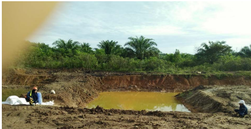
Gambar 3. Kolam Pengendapan Lumpur PT Baturona Adimulya

PT Baturona Adimulya melakukan pengurasan lumpur sebanyak 4 kali dalam 1 tahun sehingga setiap kompartemen harus menyediakan volume sebesar 5.487 m 3 . Berdasarkan perhitungan yang dilakukan maka dimensi kolam pengendapan lumpur yang akan direncanakan adalah dengan panjang 32 m, lebar 22 m dan kedalaman KPL 8 m. Sehingga kolam pengendapan lumpur aktual pada tahun 2017 harus diperbesar sesuai dengan dimensi kolam pengendapan lumpur yang direncanakan (Gambar 4). Adapun perbandingan antara dimensi KPL aktual dan rencana dapat dilihat dari tabel diatas (Tabel 1)