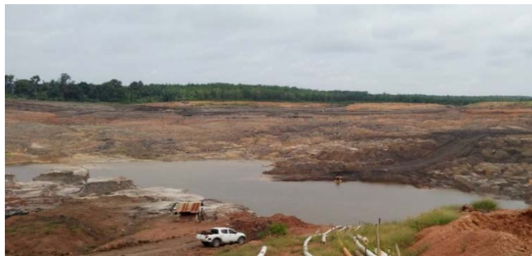
Gambar 1. Sump PT Baturona Adimulya

PT Baturona Adimulya hanya memiliki 2 unit pompa dengan jumlah debit 612 \text{ m}^3 sehingga dibutuhkan penambahan jam kerja menjadi 20 jam yang semula hanya 12 jam untuk mengeluarkan debit air masuk. Namun, PT Baturona Adimulya hanya memiliki 1 shift kerja untuk operator pompa sehingga penambahan jam kerja diasumsikan tidak akan efisien. Oleh karena itu, dalam jam kerja 12 jam/hari dibutuhkan penambahan pompa sebanyak 1 unit