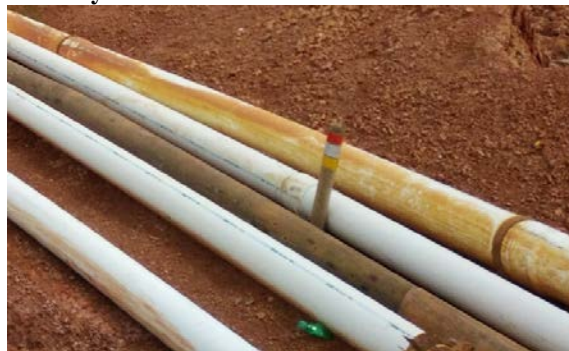
Gambar 2. Pipa yang digunakan di PT Baturona Adimulya