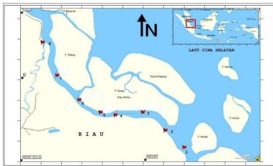
Gambar 1. Sebaran stasiun penelitian (keterangan nama stasiun pengamatan: 1. Pulau Serapung, 2 Pulau Tiga, 3 Pulau Panjang, 4 Tanjung Penakat, 5 Parit Ambai, 6 Tanjung Tanah, 7 Lalan dan 8 muara Sungai Siak)

2013 di perairan estuari Selat Panjang Riau, seperti ditunjukkan pada Gambar 1.