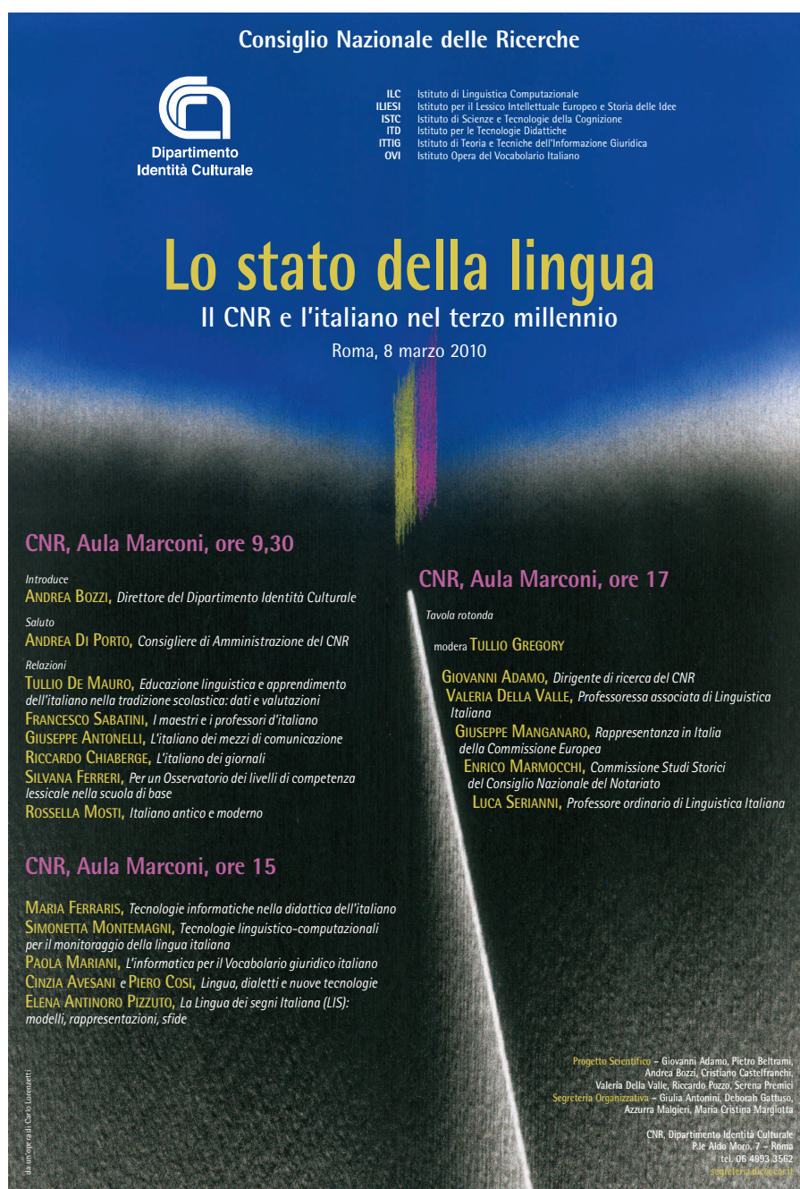
Figura 6: locandina del convegno Lo stato della lingua. Il CNR e l'italiano nel terzo millennio (2010).