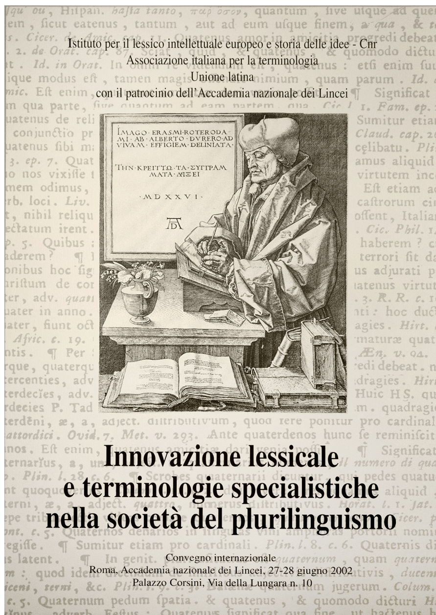
Figura 4: locandina del Convegno internazionale Innovazione lessicale e terminologie specialistiche nella società del plurilinguismo (2002).