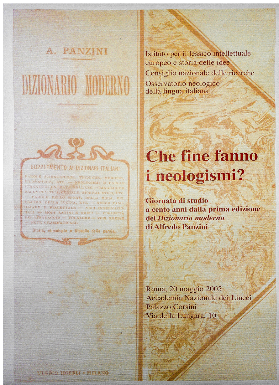
Figura 5: locandina della Giornata di studio Che fine fanno i neologismi? (2005).