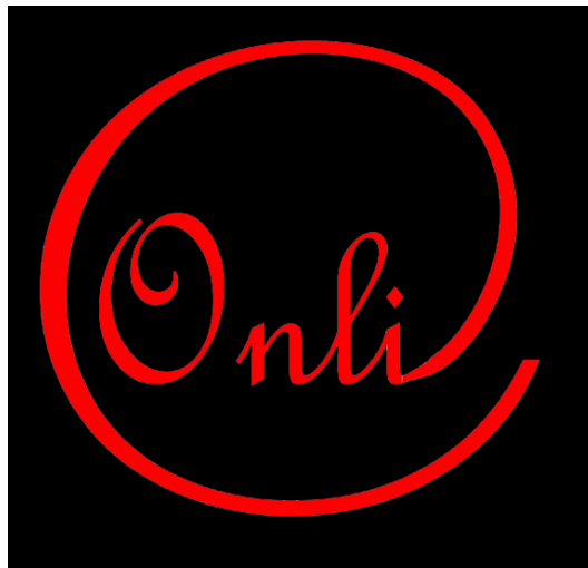
Figura 1: logo dell'Osservatorio Neologico della Lingua Italiana dell'ILIESI-CNR.