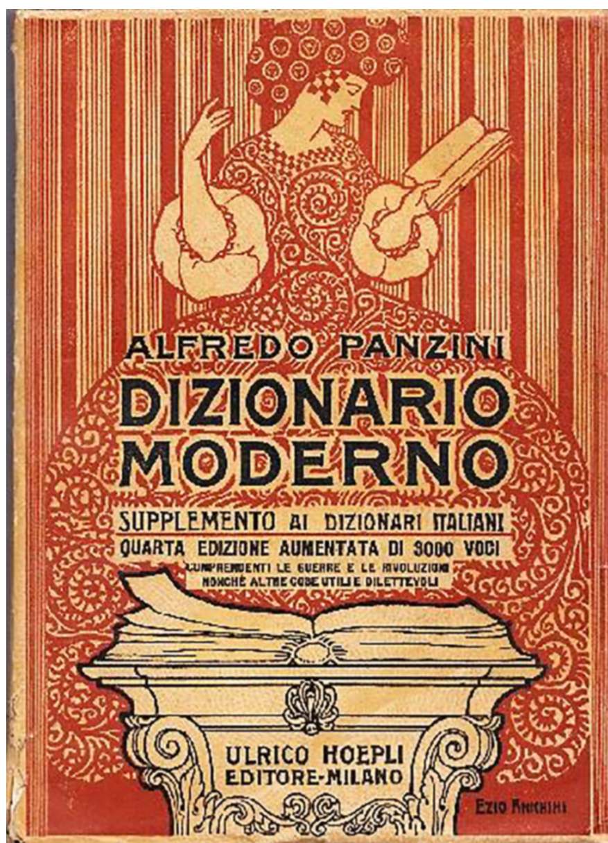
Figura 2: copertina della quarta edizione (1923) del Dizionario moderno di Alfredo Panzini.

1927, 1931, 1935), fino all'ottava edizione, postuma, curata nel 1942 da Alfredo Schiaffini e Bruno Migliorini.