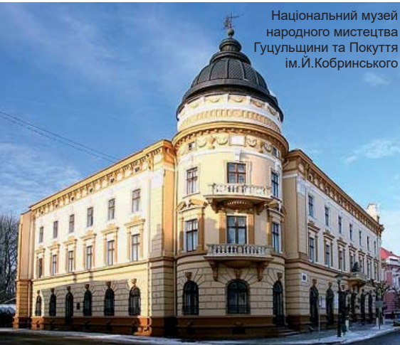
Національний музей народного мистецтва Гуцульщини та Покуття ім. Й. Кобринського