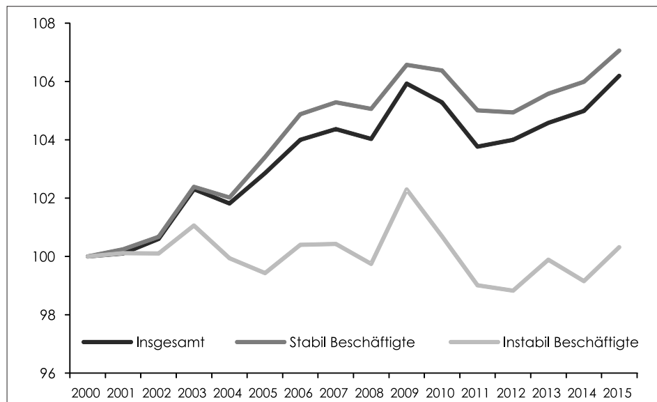
Abbildung 2: Reale Entwicklung der Bruttomonatslöhne nach Beschäftigungsstabilität, 2000-2015

Bei einer Betrachtung der Löhne über die Zeit zeigen sich deutliche Unterschiede in Abhängigkeit von der Stabilität der Beschäftigung: Bei den unselbstständig Beschäftigten hatten stabil Beschäftigte zwischen 2000 und 2015 reale Lohnzuwächse von knapp über 7%. Die Gruppe der instabil Beschäftigten konnten keine Reallohnzuwächse realisieren, bei ihnen