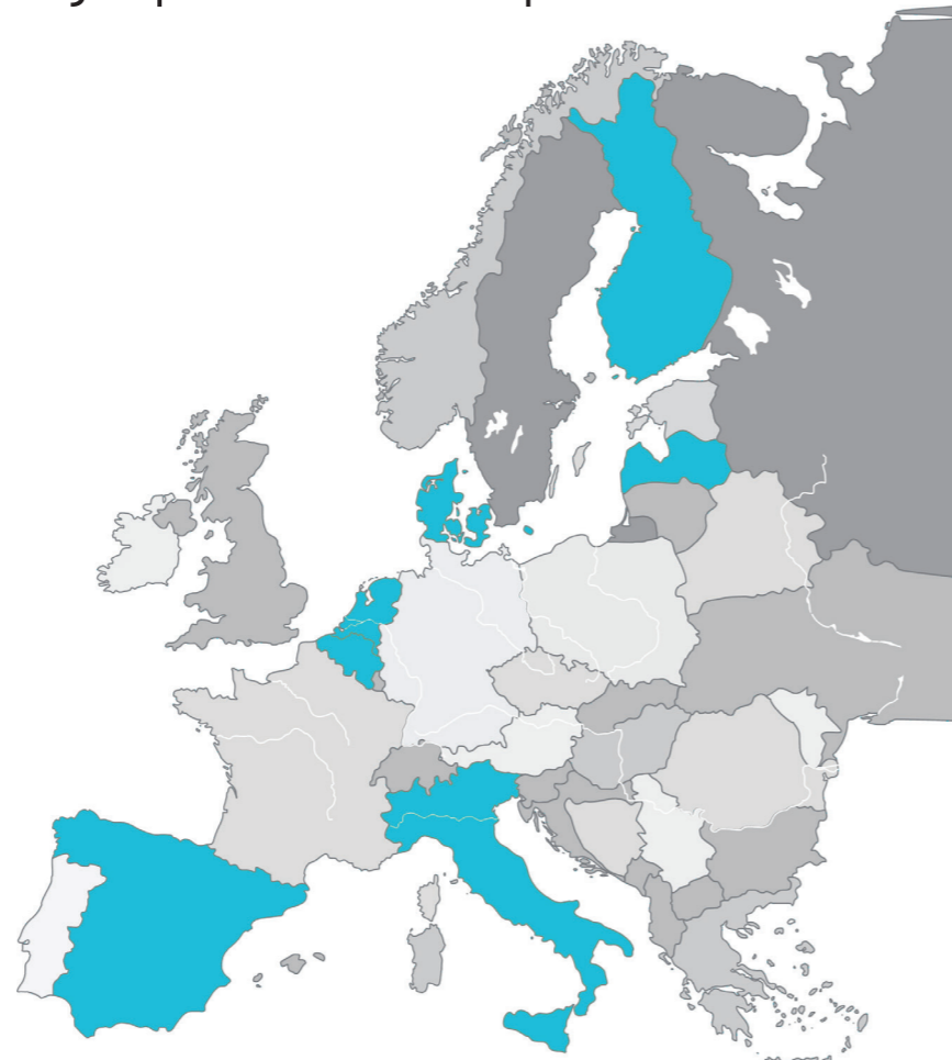
Fig. 1. Dyrkningssystemerne designes og afprøves i 7 europæiske lande.

I SUREVEG udvikles nye økologiske dyrkningssystemer til produktion af grøntsager. Målet er at forbedre systemernes bæredygtighed og resiliens, recirkulering af næringsstoffer og jordens lagring af kulstof.