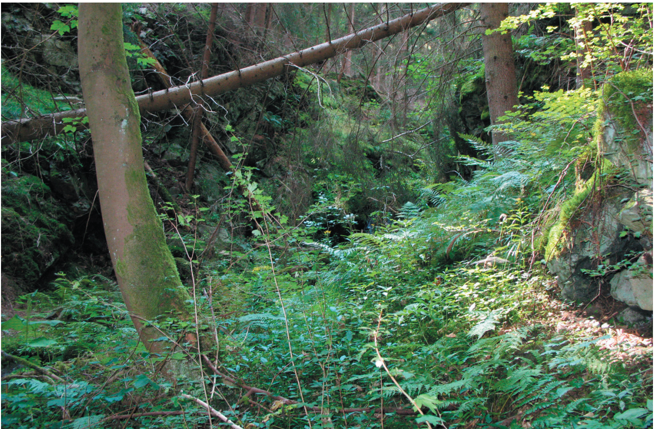
Obr. 3. Lokalita č. 11 – jedna z nejcennějších částí rezervace po malakologické stránce.

Fig. 2. Detail of the talus slope at site number 5.