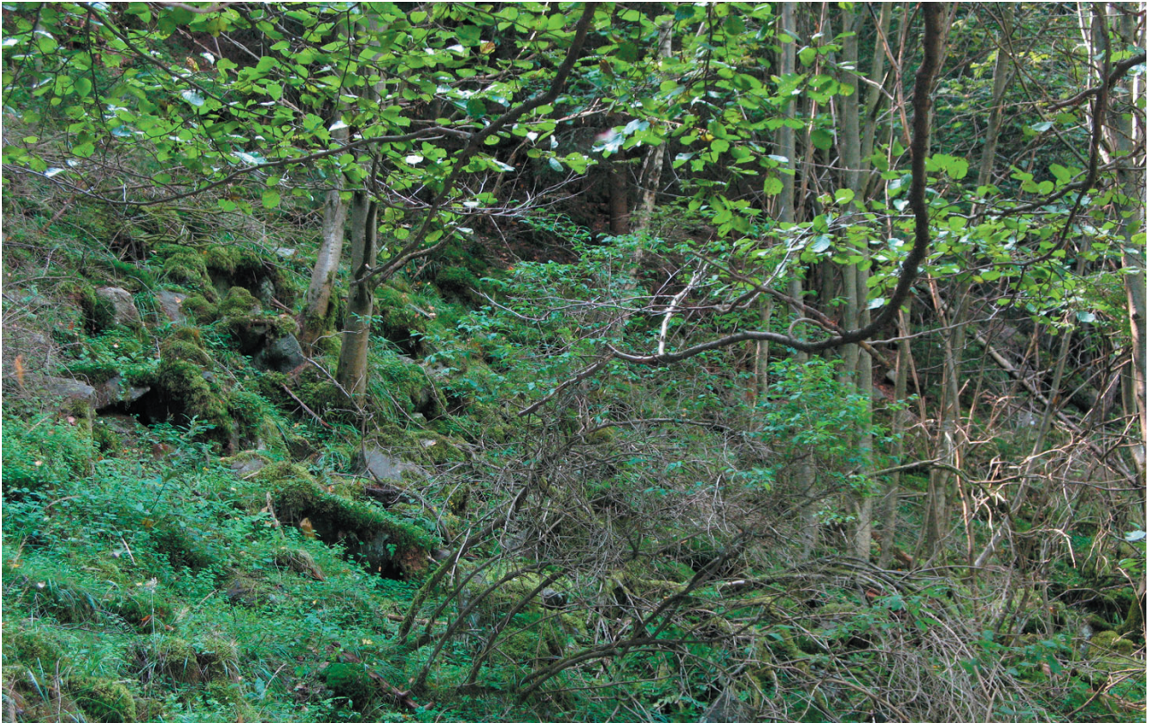
Obr. 2. Detail sutě na lokalitě číslo 5.

15. Skály s lišejníky, třtinou a vřesem na levém břehu Teplé, kousek od lokality 1. 50°2'45" N, 12°49'12" E, 590 m n.m. Ruční sběr, 24.9.2007.