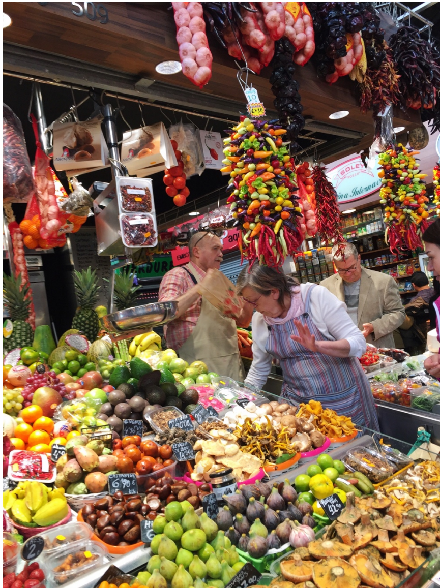
Frutas de la boqueria