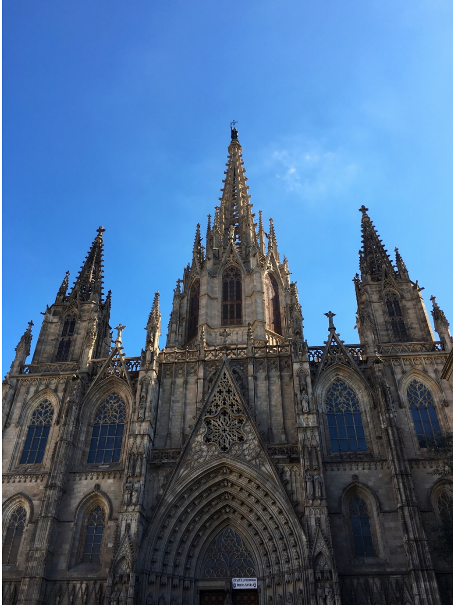
Catedral de Barcelona