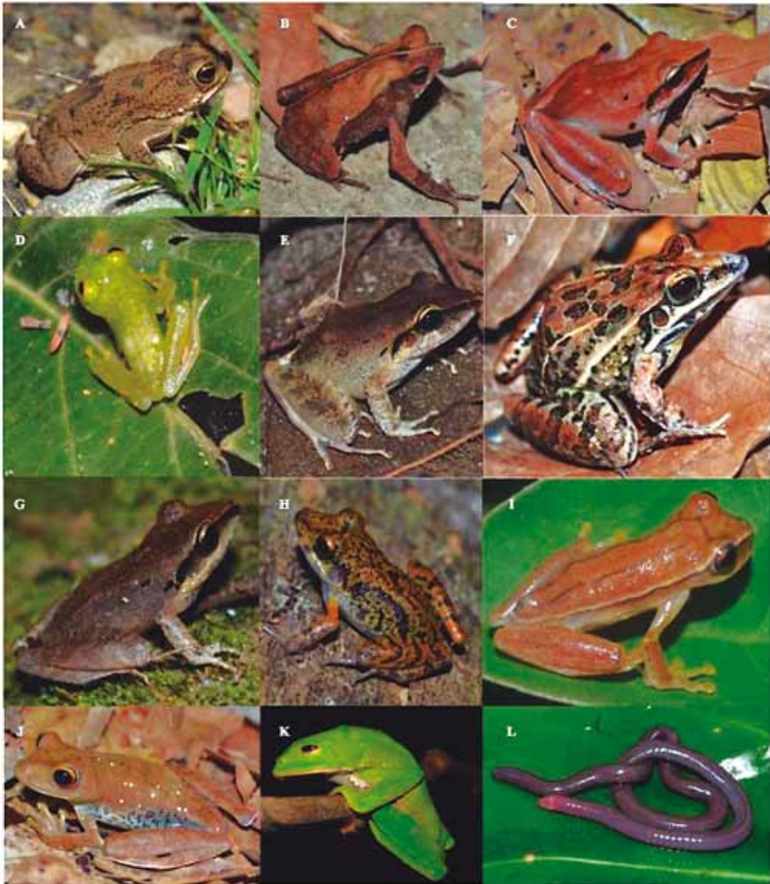
Figura 1. Registro fotográfico de algunas de las especies de anfibios capturadas en la hacienda La Española, corregimiento de Guarinocito, Caldas, Colombia. A) Rhinella humboldti , B) Rhinella margaritifera , C) Leptodactylus fragilis , D) Hyalinobatrachium fleischmanni , E) Craugastor raniformis , F) Leptodactylus fuscus , G) Craugastor fitzingeri , H) Pristimantis gaegi , I) Dendropsophus microcephalus , J) Hypsiboas boans , K) Phyllomedusa venusta , L) Caecilia thompsoni .

A partir de los estimadores estadísticos no paramétricos, Chao 1 y Jackknife 1, la representatividad obtenida para el bosque estuvo entre el 93-100% de las especies, para minería entre 93-100% y para el sistema silvopastoril entre el 70-75%. En cuanto a los singletons y doubletons , éstos sólo se cruzaron para el bosque; caso contrario a lo ocurrido en los sistemas productivos que sólo estuvieron próximos a hacerlo (Figura 2). Respecto a las especies exclusivas para cada sitio, en el bosque se registró un total de 10, mientras que en los sistemas productivos sólo 1 en cada uno (Figura 3).