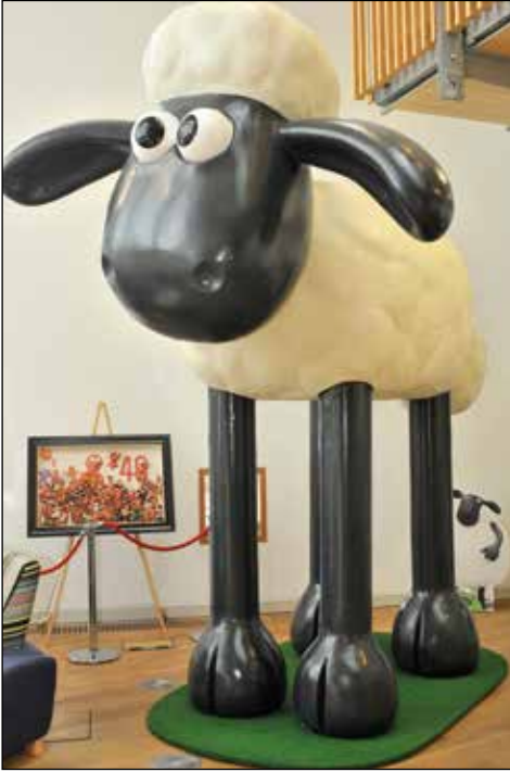
Afb. 2. In de Aardman Studios in Bristol

is een combinatie van het Nederlandse ‘aard’ en het Engelse ‘man’ (de eerste animaties hadden een eenvoudige kleifiguur, een ‘aardman’, als protagonist).