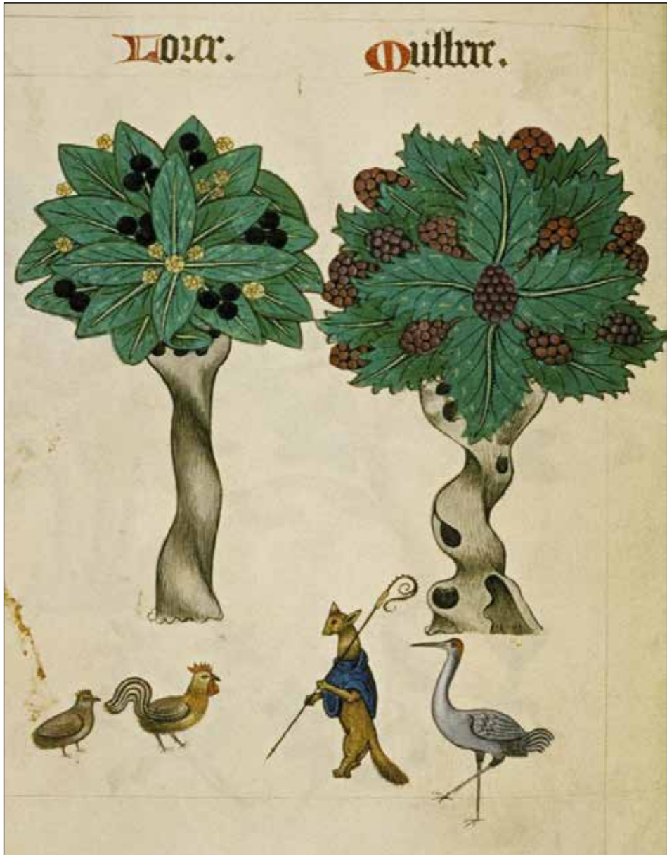
Afb. 4. Oxford, Bodleian, MS Ashmole 1504, fol. 22v. © The Bodleian Libraries, University of Oxford. Gereproduceerd met toestemming.