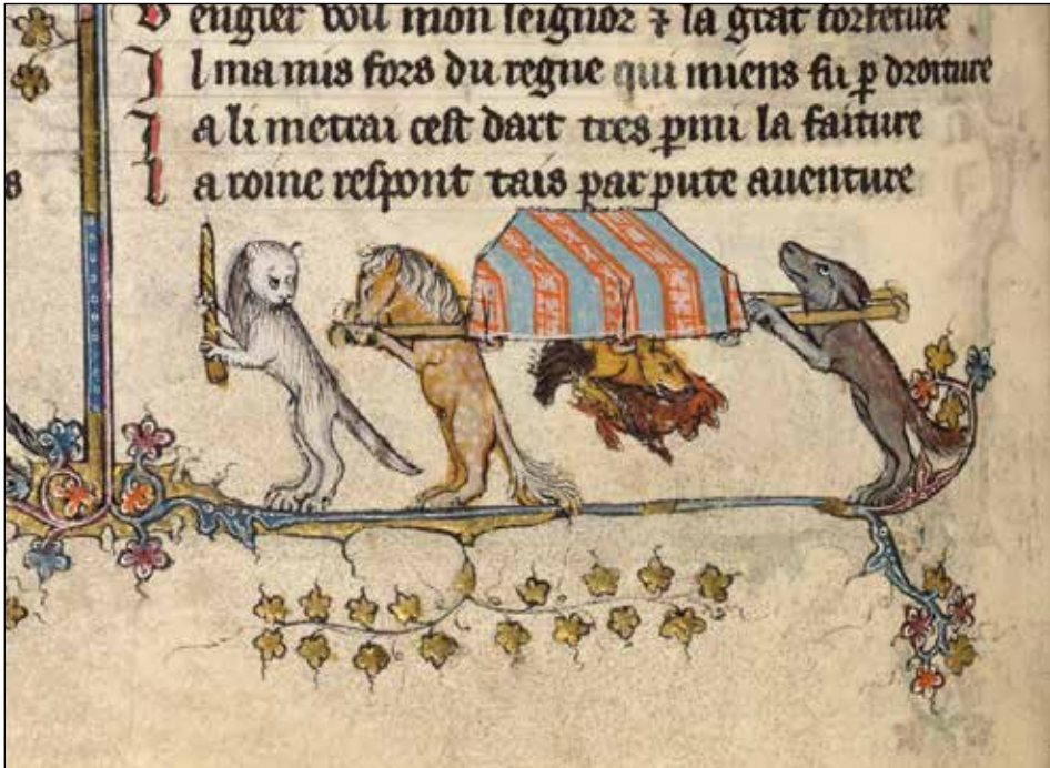
Afb. 3. Detail van Oxford, MS Bodley 264 pt 1, fol. 79v. © The Bodleian Libraries, University of Oxford. Gereproduceerd met toestemming.

naert springt haastig het graf uit, grijpt Cantecler de haan en ontsnapt. De verluchter heeft het verhaal ingekort en verbeeldt de aanval van Reynaert op Cantecler alsof die plaatsvindt terwijl de vos nog in de baar gedragen wordt; zijn hoofd is zichtbaar onder de baar, met Cantecler al in zijn mond.