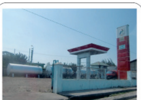
Gambar 3. Tempat Pengisian BBM di PPS Belawan.

PPSB dalam kondisi baik namun tidak berfungsi. Pembongkaran ikan di PPSB biasanya dilakukan secara manual oleh nelayan sendiri atau kelompok buruh bongkar ikan yang tergabung dalam Serikat Pekerja Seluruh Indonesia (SPSI) Gabion Belawan. Penyimpanan ikan yang biasanya terdapat di PPSB dalam bentuk cold storage , fiber yang diberi es atau wadah yang diberi es dan ditutup dengan plastik. Pengelola penyimpanan ikan dilakukan oleh pedagang dan nelayan. Doking kapal/perahu tersedia di PPSB dimana lokasinya berada di dalam pelabuhan perikanan. Doking kapal berada dalam kondisi baik tetapi tidak berfungsi. Fasilitas pengisian BBM di PPSB baik dan berfungsi dimana dapat menyediakan hingga lebih dari 1000 kilo liter per bulan.