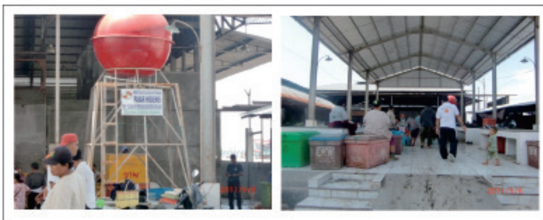
Gambar 4. Pasar Ikan Higienis yang Berada didalam Kawasan PPS Belawan, Tahun 2011.

c. Fasilitas Penunjang, merupakan fasilitas yang secara tidak langsung meningkatkan peranan pelabuhan perikanan dan tidak dapat dimasukkan ke dalam kelompok kedua golongan tersebut. Yang menjadi fasilitas penunjang di PPSB meliputi Masjid/ mushola (120 m 2 ), guess house (150 m 2 ), kendaraan roda 4 (3 unit) dan kendaraan roda 2 (7 unit) dan Gedung Serba Guna (175 m 2 ).