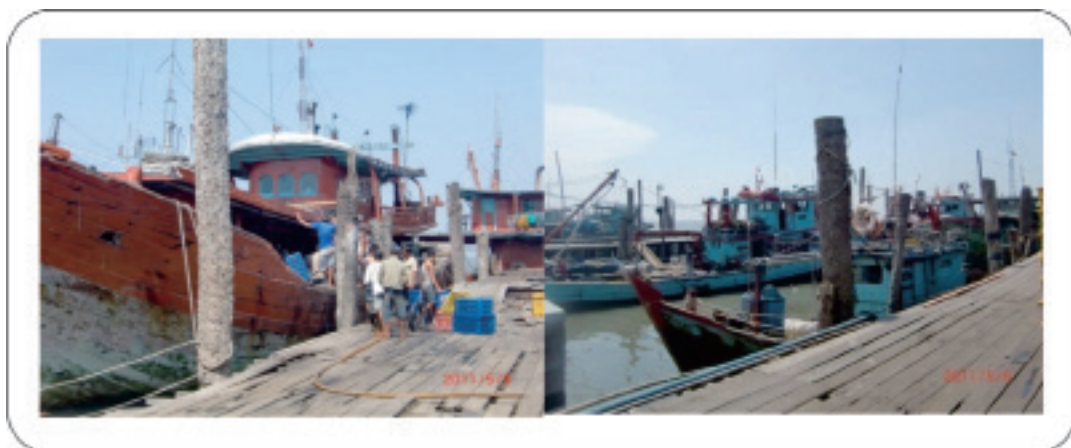
Gambar 1. Kondisi Dermaga Kapal yang Berada di Gudang Milik Pengusaha (Tangkahan) di PPS Belawan, 2011.

Kondisi jalan raya dari dan ke pelabuhan perikanan beraspal kondisi baik dan terbuat dari paving block , sedangkan kondisi jalan di beberapa titik di dalam pelabuhan mengalami kerusakan. Dermaga di PPSB dalam kondisi baik dan berfungsi dan berada di bawah tanggungjawab pengelolaan UPT Pusat namun daya dukung dermaga sudah sangat optimal dimana tidak dapat menampung seluruh kapal/perahu penangkap ikan yang ada. PPSB memiliki kolam labuh pelabuhan dan dapat menampung 100-200 unit kapal/perahu penangkap ikan yang ukurannya antara 10-30 GT. Saat ini kolam labuh pelabuhan mengalami pendangkalan.