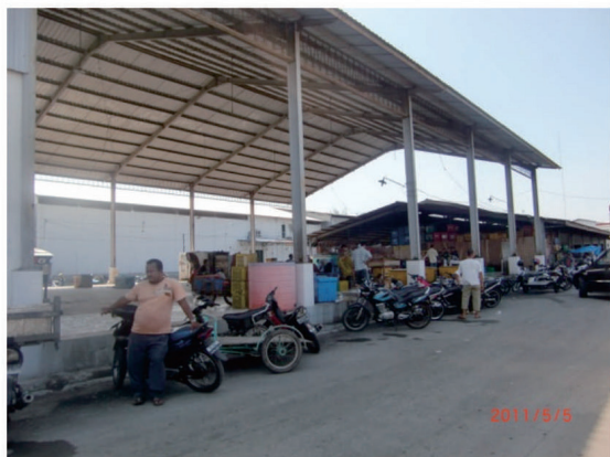
Gambar 2. Sistusi di TPI Pada Saat Tidak Operasional.

b. Fasilitas Fungsional, merupakan fasilitas yang berfungsi meningkatkan nilai guna dari fasilitas pokok dengan cara memberikan pelayanan yang diperlukan. Fasilitas fungsional yang ada di PPSB antara lain: kantor pelabuhan (856 m 2 ), TPI (800 m 2 ), transheed sheet (670 m 2 ), pabrik es berjumlah 4 unit dengan kapasitas 406 ton atau lebih dari 1000 balok/hari dikelola oleh swasta dan 1 unit dikelola oleh Perum PPSB, instalasi air bersih (2 unit), instalasi BBM terdiri dari APMS (7 unit oleh swasta sebesar 4.860 Kl/bulan dan SPDN dikelola oleh PPSB dengan alokasi sebesar 306 Kl/bulan), instalasi listrik (1.110 KVA), telekomunikasi (1 unit), bengkel oleh swasta (4 unit), gedung pertemuan nelayan (150 m 2 ), kantor administrasi (200 m 2 ), MCK (2 unit), rumah jaga (90 m 2 ), kios/Waserda (28 unit) dan cold storage oleh swasta (3 unit) dengan kapasitas > 60 ton.