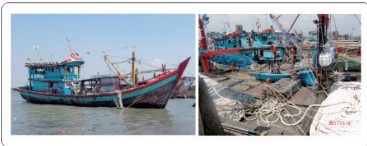
Gambar 6. Salah Satu Jenis Kapal dan Alat Penangkap Ikan yang Digunakan Nelayan di PPS Belawan, Tahun 2011.

Sedangkan jumlah kapal menurut ukuran armada dan jenis alat tangkap dapat dilihat pada Gambar 7 sebagai berikut.