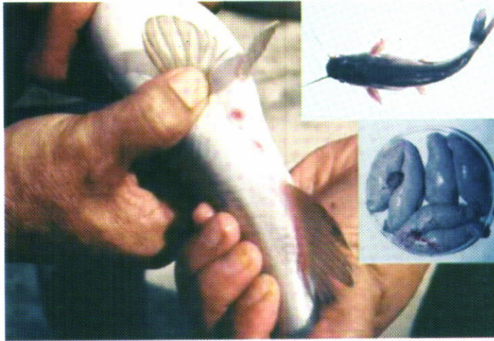
Gambar 2. Induk betina matang kelamin.

diperoleh dari daerah aliran Sungai Batanghari, Jambi yaitu di Muara Bungo. Induk jantan dengan penampakan yang sama papillanya setelah dibedah nampak sperma ikan baung secara keseluruhan semua berwarna putih susu tidak ada yang berwarna bening atau jernih.