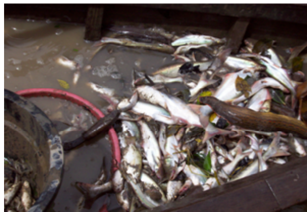
Gambar 6. Ikan blumbungan ( Otolithus rubber ).

Nilai indeks keragaman jenis ikan hasil tangkapan blad di perairan estuaria Sungai Upang (2,87), Sungai Musi (1,95), Sungai Banyuasin (1,67), dan Sungai Sembilang (2,17). Indeks keragaman jenis ikan ( H' ) di 4 lokasi penelitian mempunyai nilai <3 dan >1 , keragaman jenis tingkat sedang (Newman, 1995).