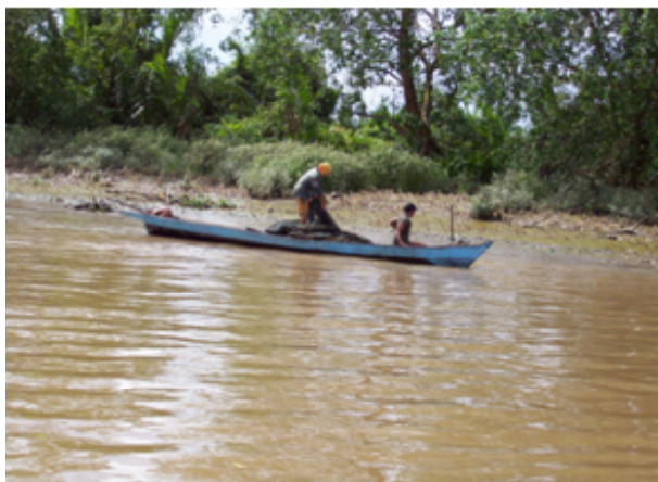
Gambar 2. Jaring blad dipasang pada pantai yang landai saat air surut.

Kedua ujung unit jaring blad dipasang mengarah daratan yang lebih tinggi. Alat tangkap blad dipasang di pantai yang landai dengan jarak antara 7 sampai dengan 10 m dari daratan tepian sungai, sehingga pada ketinggian air tertentu didapat lahan jebakan rata-rata 900 sampai dengan 3.600 m 2 . Alat tangkap blad dioperasikan pada saat pasang purmana atau pasang tunggal yaitu 14 sampai dengan 18 hari per bulan, sepanjang tahun, dominan musim kemarau. Dibanding jenis alat tangkap yang lain berdasarkan pada jumlah dan sebaran, alat tangkap blad dominan ke-2 setelah alat tangkap tuguk ( filtering device ). Lokasi pemasangan blad setiap hari operasi berpindah atau bergeser ke tempat lain sampai dengan beberapa waktu kembali lagi. Operasional alat dikerjakan oleh 2 sampai dengan 3 orang, tahap persiapan memerlukan waktu kerja \pm 30 menit, pemasangan alat \pm 15 menit, dan penen \pm 40 menit per 100 m jaring blad. Total waktu yang diperlukan 1 trip operasi 85 menit per 100 m jaring blad.