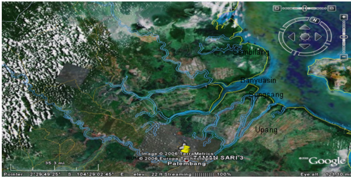
Gambar 1. Peta perairan estuaria Sungai Upang, Sungai Musi, Sungai Banyuasin, dan Sungai Sembilang Kabupaten Banyuasin, Sumatera Selatan, tahun 2006.

Sembilang Kabupaten Banyuasin, Sumatera Selatan (Gambar 1) pada tahun 2006.