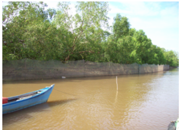
Gambar 3. Lahan blad pada saat air surut.