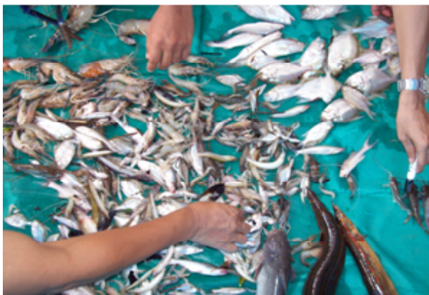
Gambar 5. Ikan blumbungan ( Otolithus rubber ).