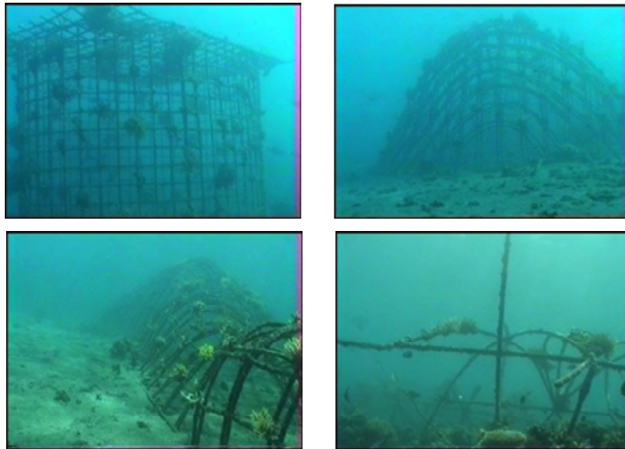
Gambar 5. Design beberapa terumbu buatan sekaligus sebagai wadah transplantasi karang untuk tujuan meningkatkan pariwisata di perairan Pemuteran, Buleleng, Bali.