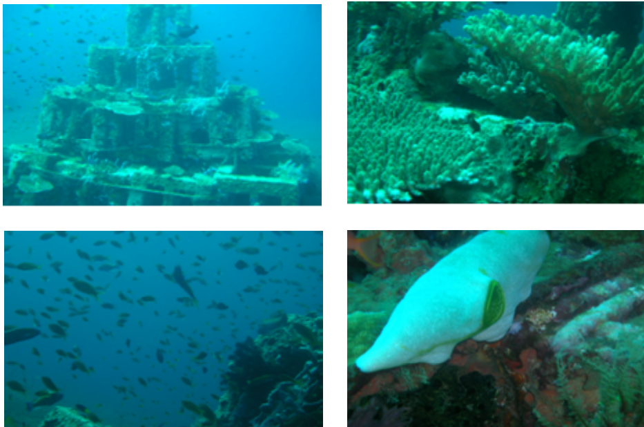
Gambar 2. Kondisi ekosistem terumbu buatan pada usia 15 tahun di perairan Tukadse, Karangasem, Bali.