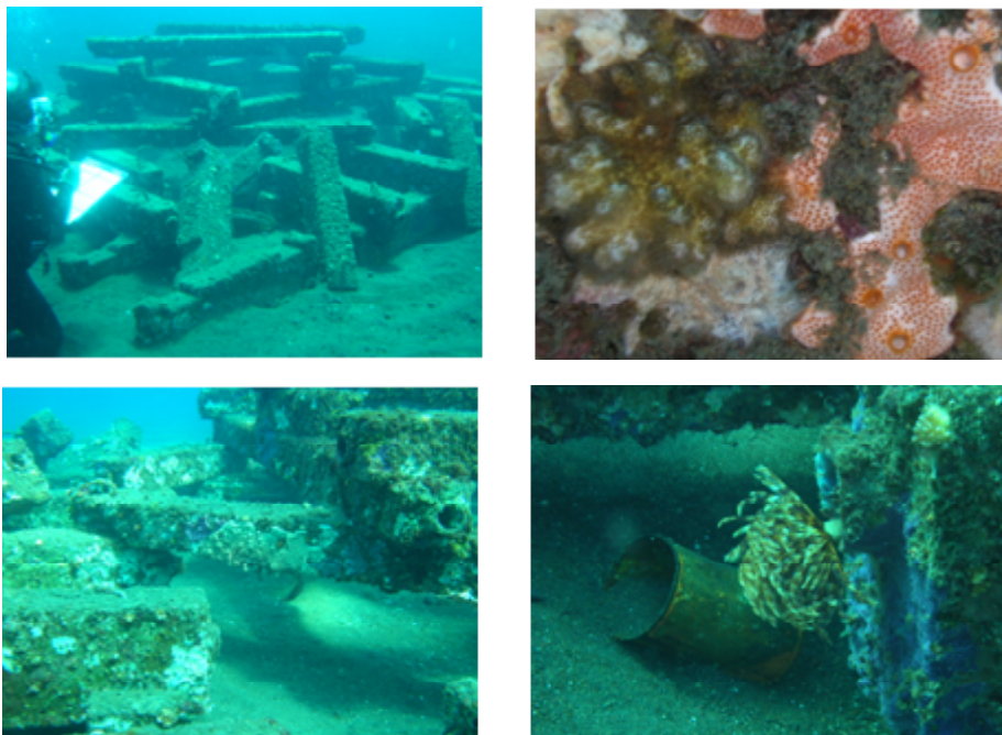
Gambar 4. Terumbu buatan dengan desain dan konfigurasi sama dengan Gambar 3 di perairan Tukadse, Karangasem, Bali yang sudah berumur 2 tahun.