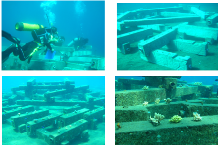
Gambar 3. Terumbu buatan dari beton panjang disusun bertingkat dan sekaligus sebagai substrat transplantasi karang.