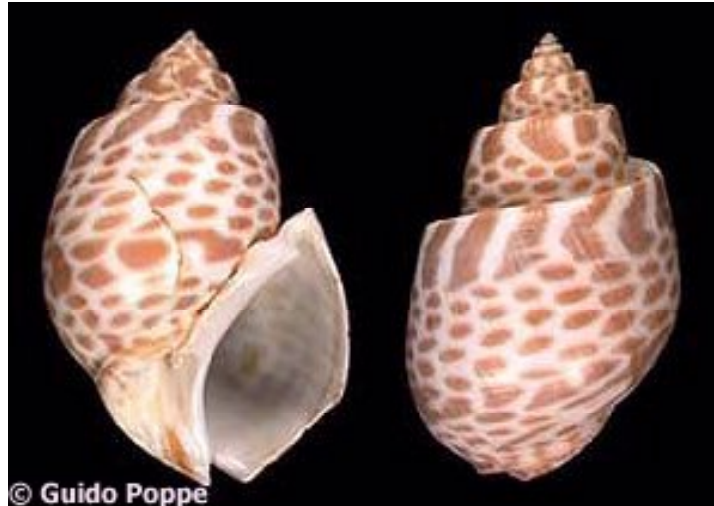
Gambar 1. Keong macan ( Babylonia spirata , Linnaeus, 1758).

dan melekat. Mengalami torsi yaitu peristiwa di mana cangkang beserta tubuh di belakang kepala yang terdiri atas massa viskeral, mantel, dan rongga mantel memutar 180° yang berlawanan dengan arah jarum jam. Peristiwa ini dimulai pada waktu stadia veliger sampai dengan kepala dan kaki kembali lagi pada posisi semula (Dharma, 1998).