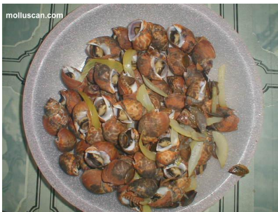
Gambar 3. Keong macan yang sudah direbus.

Semula nelayan Indonesia memandang keong macan sebagai hasil laut seperti siput-siput laut lain. Pengolahan keong ini hanya dilakukan secara sederhana. Daging direbus seperti terlihat pada Gambar 3, dijemur dan disetor kepada para pengepul dengan harga yang relatif murah (Rp.5.000,- per kg). Seperti hal nelayan di Teluk Pelabuhanratu, Manggar-