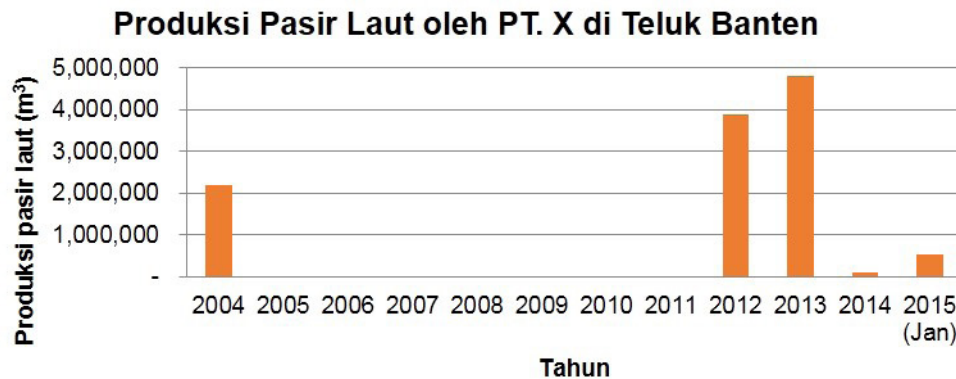
Gambar 2. Produksi Pasir Laut oleh PT. X di Teluk Banten.