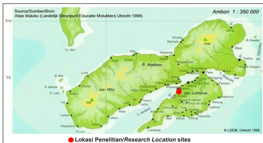
Gambar 1. Lokasi Penelitian Figure 1. Research Location

Penelitian ini dilaksanakan di pusat olahan ikan asap di Negeri Hative Kecil Kota Ambon pada bulan April-Agustus 2014.