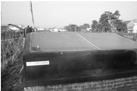
Gambar 1. Solar Water Heater Sederhana

Menurut Ismail dan Farid (2006), pelat penyerap ganda dapat meningkatkan kinerja solar water heater sederhana dibandingkan menggunakan pelat penyerap tunggal. Dalam saran; perlu dilakukan peningkatan intensitas radiasi matahari dan peningkatan luasan permukaan atau luasan pelepasan panas ( Fr ) yang berhubungan dengan fluida kerja untuk meningkatkan kinerja solar water heater sederhana.