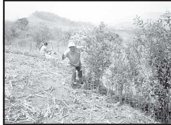
Figura 2. Fotografías de las parcelas con tecnologías de conservación de suelos y aguas implementadas por agricultores en las zonas en estudio. A: Barreras muertas construidas con piedras. B: Barreras vivas de gandul en combinación con barreras muertas de piedras