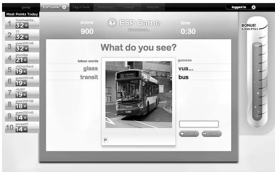
Abb. 1 Aufgabenstellung im ESP Game

Objekte in Bildern zu erkennen oder Sprache zu transkribieren. 8 Überdies komme es in der Welt alltäglich zu einer «immensen Verschwendung menschlicher Hirnzyklen»; 9 man denke allein «an die 9 Mrd. Stunden, die Menschen im Jahr 2003 weltweit Solitär gespielt haben». 10 Menschen seien also gute Rechenmaschinen und ihre Rechenleistung sei auch noch im Überfluss verfügbar – aus diesen beiden Prämissen setzt von Ahn das Programm seiner Forschung im Bereich der HCI zusammen: «Ich werde ein Computerprogramm in menschlichen