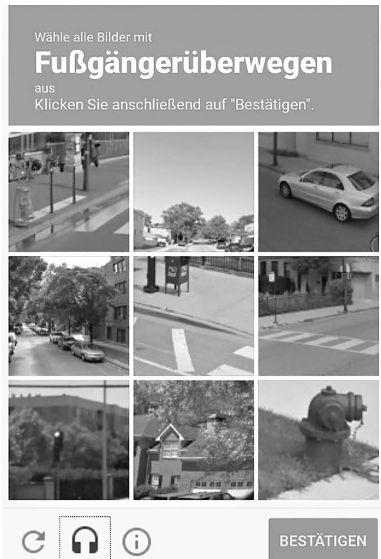
Abb. 2 Beispiel für ein CAPTCHA des Googledienstes reCAPTCHA

Ng stellt nun die interessante Behauptung auf, dass heutzutage genau genommen nur noch der zweite Punkt – die Verfügbarkeit von Trainingsdaten – eine knappe Ressource darstelle. Tatsächlich ist Rechenleistung seit einigen Jahren auf industriellem Maßstab als Dienstleistung verfügbar – Services wie die Google ML-Cloud erlauben es jedem kleinen Unternehmen, DL-Modelle anhand