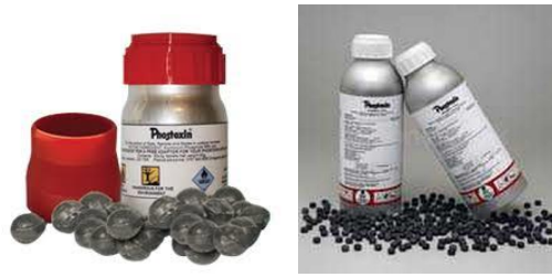
Gambar 9. Ilustrasi Phostoksin Tablet

mudah digunakan untuk mengendalikan hama di tempat penyimpanan dokumen.