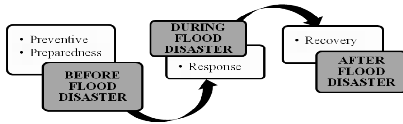
Gambar 1. Fase Penanganan Bencana Banjir

Fase pertama , berkaitan dengan rutinitas sehari-hari, yang meliputi fase pencegahan dan kesiagaan menghadapi bencana banjir. Pencegahan mencakup kegiatan yang berfungsi meminimalisir kemungkinan terjadinya bencana banjir. Kesiapsiagaan mencakup kegiatan untuk mengidentifikasi terhadap koleksi yang sangat penting, penyediaan perlengkapan untuk membersihkan dan menyelamatkan koleksi setelah bencana banjir, serta pelatihan setiap SDM perpustakaan agar senantiasa tanggap dan siap terhadap kemungkinan datangnya bencana banjir. Kelengkapan perencanaan kesiapsiagaan bencana banjir diperlukan untuk meminimalisir kerusakan yang ditimbulkan dari akibat bencana banjir tersebut.