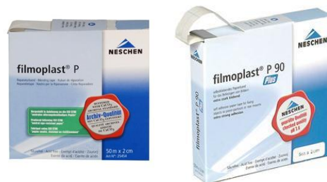
Gambar 2. Filmoplast

Mengisi lubang-lubang dan bagian yang hilang pada kertas. Caranya menggunakan tisu jepang ( japanesse tissues ) maupun hand made paper secukupnya dan dengan lem dari bahan kanji atau dari bubuk Carboxyl Methly Cellulose (CMC) sebagai perekat kemudian ditempelkan pada lubang. Selain itu, bisa juga menggunakan filmoplast® P, yaitu sejenis silotape yang memiliki tingkat keasaman yang baik untuk kertas. Untuk bentuk filmoplast seperti nampak pada Gambar 2 berikut: