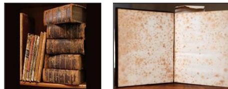
Gambar 5. Buku Berjamur

Bagaimana dengan buku yang berjamur? Buku-buku yang lembab karena air dan mulai berjamur (seperti contoh pada Gambar 5), cara penanganannya yaitu pada permukaannya disemprotkan dengan alkohol 99%.