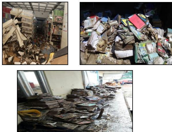
Gambar 4. Ilustrasi Berisiko Tinggi

Lalu bagaimana dengan bahan perpustakaan yang terkena bencana banjir? Untuk risiko bahan perpustakaan yang terkena bencana banjir termasuk dalam kategori berisiko tingkat tinggi, apalagi jika terkena lumpur pekat yang berwarna coklat kehitaman. Kategori berisiko tinggi seperti terlihat pada Gambar 4 berikut: