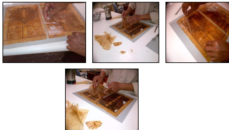
Gambar 6. Contoh Konservasi Manuskrip

Jika di perpustakaan ada koleksi jenis manuskrip (seperti di Perpustakaan Nasional RI), maka manuskrip yang basah harus segera dikeringkan dengan menggunakan blotting paper atau tissue penyerap pada setiap halamannya. Namuna apabila kotor berlumpur, maka jangan sekali-sekali mencucinya. Hal ini karena tinta akan menyebar dengan cepat sehingga tulisan tidak terbaca. Cara yang aman apabila manuskrip tersebut basah segera bungkus dengan plastik dan masukkan ke dalam freezer atau yang lebih baik lagi apabila menggunakan vacuum chamber . Gambar 6 berikut contoh pelestarian manuskrip: