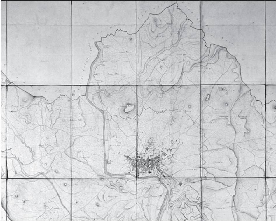
Figura 1 Fragment del [Plano geométrico del término municipal de Manresa, 1853]

La figura mostra la divisió del terme municipal en seccions cadastrals, corresponents a la seva part central i septentrional. Les 44 seccions d'aquest document resten numerades en el sentit de les agulles del rellotge. Entre els elements clarament visibles del plànol geomètric de Manresa destaquen el nucli urbà de Manresa, la divisió parcel·laria i el relleu amb normals, a més de la xarxa hidrogràfica i diferents elements planimètrics. Inclòs a Ayuntamiento de Manresa. Matriz primitiva de propiedades territoriales, urbana y ganadería de Manresa, 1853 . Arxiu de la Corona d'Aragó. Hisenda Ter-P nº 718.