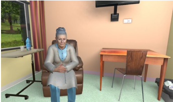
Figure 3 : Intégration de l'humain virtuel expressif au sein d'un simulateur en santé

faciales affecte positivement la perception de l'agent virtuel par l'utilisateur, son attitude et sa motivation, mais également son apprentissage [10]. Enfin, les émotions chez l'humain virtuel expressif permettraient de diminuer le stress des participants et de mieux surmonter les difficultés [11].