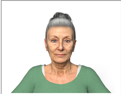
Figure 2 : Rendu de l'humain virtuel expressif