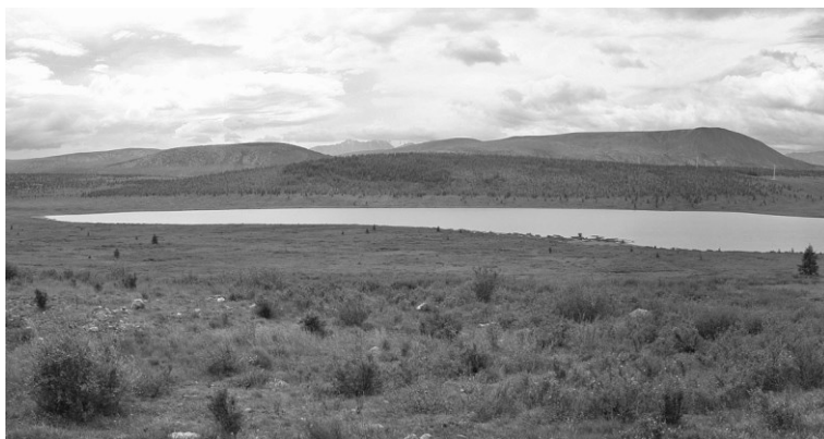
Рис. 5. Окинское озеро

Озера и озерно-болотные комплексы (ОБК) имеют как ледниковое, так и долинно-речное происхождение (рис. 5). Наиболее крупные ледниковые озера (Хара-Нур, Урунгу-Нур, Шутхулай-Нур, Дозор-Нур, Урунгу-Нур, Олон-Нур и др.) сосредоточены в высокогорной левобережной части бассейна реки Оки. Ледниковым по происхождению является также озеро Ильчир, из которого берет свое начало Иркут. В целом же для бассейна этой реки более характерны долинно-речные озерно-болотные комплексы (ОБК). Крупнейшим из таких комплексов является Койморский, озера и болота которого привлекают большое количество околотовных и водоплавающих птиц как в периоды миграций, так и в гнездовое время. Значительную площадь занимают также Нуркутульский (Мойготский) ОБК и озеро Енгарга с прилегающими к ним болотами и переувлажненными лугами.