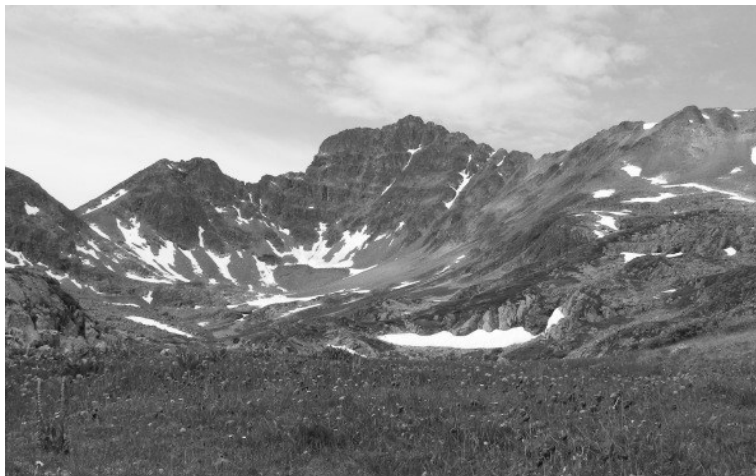
Рис. 3. Альпийские луга в Восточном Саяне (участок между реками Тисса и Сенцы)

Денудационно-эрозийный рельеф в исследуемом районе развит в виде сравнительно нешироких полос вдоль долин рек, прорезающих Тункинские гольцы и Окинское плоскогорье. Эрозионный характер носят также нижние части южных макросклонов Тункинских гольцов и Мунку-Сардыка. Среднегорье отличается здесь крутыми склонами, густо расчлененными небольшими долинами и ложбинами. В верхней части склонов базальтовых плато обычны отвесные обрывы с характерной столбчатой отдельностью. На прогреваемых поверхностях таких скал формируются крупные колонии Arus pacificus и Delichon urbica lagopoda . На влажных базальтовых скалах вблизи водопадов и речных порогов гнездится Delichon dasypus . Подножия склонов часто бывают перекрыты конусами выноса. Склоны многих долин образованы еще доледниковой эрозией и подверглись гляциальной обработке позднее. В ряде случаев крутые эрозионные склоны сохранились почти неизменными и продолжают испытывать воздействие водной эрозии, как, например, во время сильнейшего паводка в июле 2001 г.