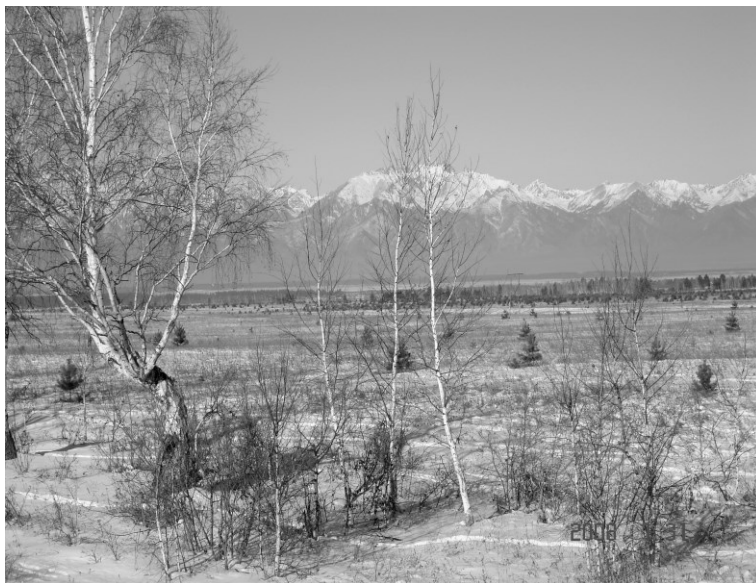
Рис. 2. Тункинская долина и Тункинские гольцы

ний в разных ее частях. Наибольшего размаха эти движения достигают в Тункинском хребте и хребте Мунку-Сардык, где амплитуда поднятий над поверхностью досреднемиоценового денудационного плато изменяется от 400–500 до 800–1000 м. Этим и объясняются максимальные высоты и глубокое расчленение указанных хребтов. Древняя поверхность выравнивания (собственно Тункинская долина и Окинское плоскогорье) была поднята здесь на значительную высоту и сохранилась благодаря компенсированному поднятию хребтов, ослабившему процессы глубинной эрозии в долине Иркутта и в бассейне верхнего течения Оки (рис.2). Это обстоятельство объясняет присутствие в поясе высоких гор типичных степных птиц ( Anthropoides virgo , Eremophila alpestris brandti , Anthus richardi , A. godlewskii , Oenanthe isabellina и др.), а также некоторых степных млекопитающих, в частности Citellus undulatus и Felis manul .