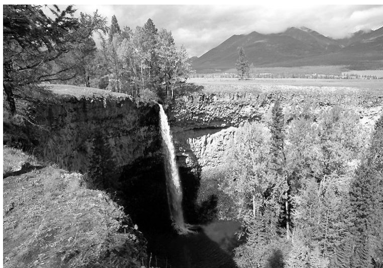
Рис. X. Водопад Сайлаг при впадении р. Бага-Жомболок в р. Оку. Здесь постоянно гнездится колония воронков.

Перелетный, гнездящийся вид. В Восточном Саяне обитает как в дикой природе, так и в населенных пунктах. Совместные поселения воронка и белопоясного стрижа обнаружены в ущельях Белого и Среднего Иркута. «Чистые» колонии воронка известны из ущелья р. Кынгарги (примерно 20 пар) и долины Оки близ с. Саяны, где колонии ласточек располагаются в обрывах вулканических лав. Ниже по течению р. Ока на равнинной местности Бага-Жомболок в обрывистом каньоне застывшей лавы, образующей водопад Сайлаг высотой 20–22 м, ежегодно поселяется до 30–40 пар воронков.