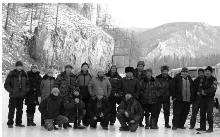
Рис. 4. На р. Диби (левый приток р. Оки). Экспедиционный отряд (январь 2009 г.)

Гидросеть на территории нашего исследования представлена главными водными артериями — Иркутом и Окой и их притоками. Левые притоки Иркута очень коротки и имеют большое падение (что связано с альпинотипным рельефом Тункинских гольцов). Правые притоки, стекающие с Хамар-Дабана (Зун-Мурэн, Харагун, Большой и Малый Зангисаны), имеют большую длину и меньшее падение вследствие сглаженного рельефа этой более древней горной страны. В бассейне верхнего течения Оки, напротив, наибольшую протяженность имеют левобережные притоки — Хорё, Диби, Тисса, Сенца, Хойто-Ока; с ними же в Оку поступает и наибольший объем воды (рис. 4). Правобережные притоки, даже самые крупные из них — Тустук, Сорок, Улзыта, значительно короче и маловоднее.