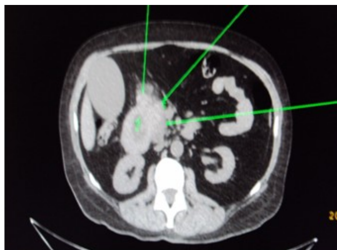
Figura 2. En la TAC se muestra la imagen tumoral que estenosa el duodeno y la dilatación de vías biliares intra y extrahepáticas. Corte transversal.