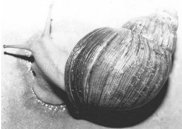
Figure 1: Archachatina ventricosa (Gould, 1850).

Au total, 250 juvéniles de A. ventricosa ont été utilisés dans cette étude qui a duré 48 semaines; de novembre 2003 à octobre 2004. Dix lots de 25 escargots chacun ont été constitués avec une densité de 100 escargots / m 2 . Ces lots sont disposés dans des bacs en polystyrène à base carrée de 0,5 m de côté avec une hauteur de 0,125 m; soit 0,25 m 2 de surface de base pour un volume de 0,038 m 3 . Les bacs sont dotés d'un couvercle perforé de type moustiquaire constituant le dispositif anti-fuite et permettant l'aération