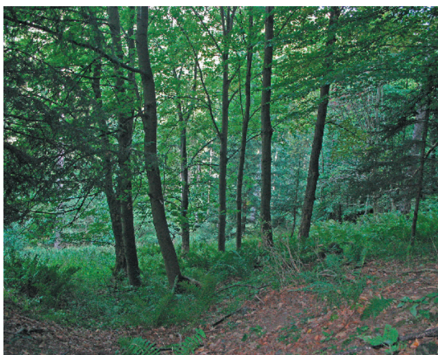
Fig. 4. Locality No. 7. Lime on talus slope forest and rocks. Rich and interesting mollusc assemblage surprisingly without Clausilia bidentata , which probably prefers maple.

třída: Gastropoda podtřída: Pulmonata nadřád: Eupulmonata čeleď: Carychiidae