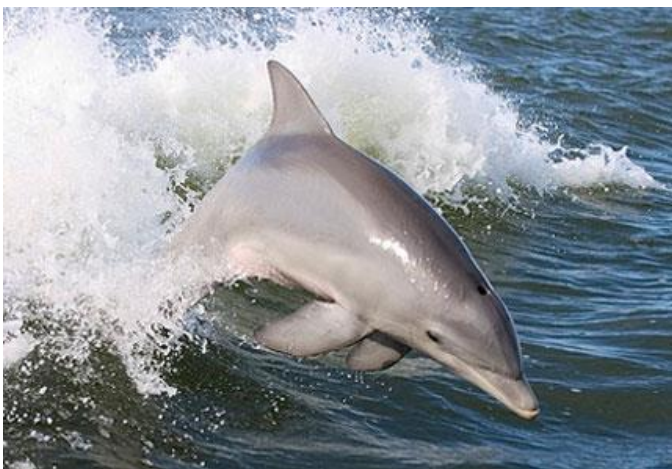
Slika 8. Dobri dupin

Najinteligentnija životinja i vjerovatno najomiljenija morska životinja. Dupin je sisavac, iz tog razloga nije stalno pod vodom jer udiše kisik iz zraka.