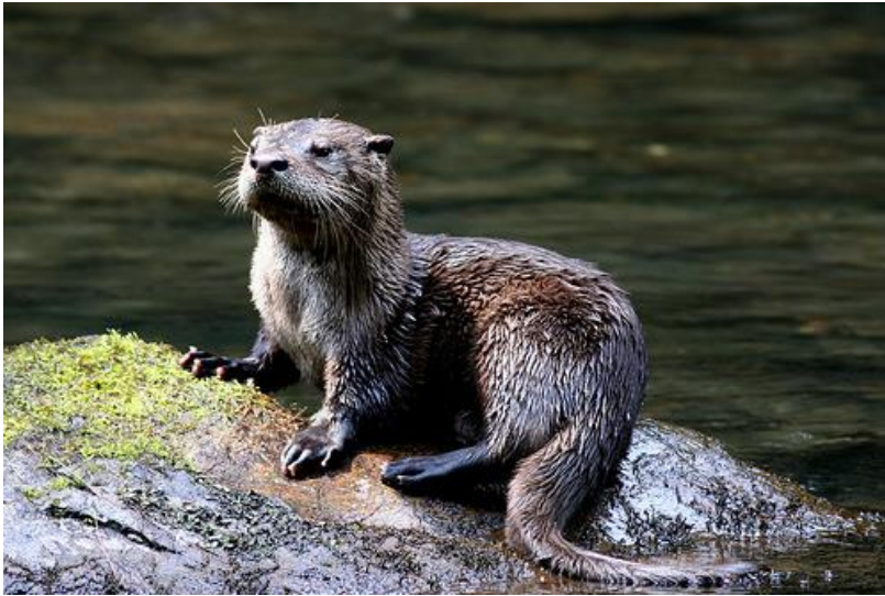
Slika 9. Vidra

Vidre imaju mekani Isoj krzna koji ih štiti od vode i grije ih. Vitkih su tijela i kratkih udova. Imaju plivaće kožice koje im omogućavaju brzo kretanje u vodi. Zanimljivo je da vidra mora uhvatiti 100 grama ribe u jednom satu kako bi prikupila dovoljno energije za boravak u hladnoj vodi.