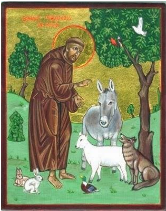
Slika 1. Sv. Franjo Asiški sa životinjama

Prvi put Svjetski dan životinja spominje se 1924. u zahtjevu njemačkog pisca Heinricha Zimmermanna. 1929. u Beču se održao treći Međunarodni kongres zaštite životinja. Ondje je prihvaćen popis zahtijeva, te je posljednja točka zahtijeva bio Dan zaštite životinja. Na konvenciji ekologa u Firenci 1931. proglašen je Svjetski dan zaštite životinja. Datum 4. listopada je simbolično odabran, jer se taj dan obilježava svetkovina zaštitnika životinja, sv. Franje Asiškog.