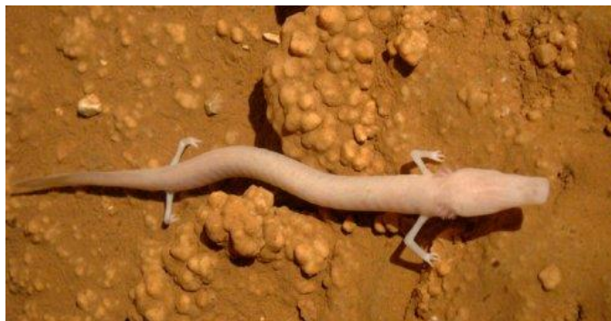
Slika 10. Čovječja ribica

Lat. Proteus anguinus , je endem Hrvatskog primorja. Spada u skupinu vodozemaca I teži svega 17 grama. Živi u podzemnim vodama I mračnim špiljama na određenoj temperaturi. Diše plućima I kožom ali zadržala je čupave škrge na glavi.