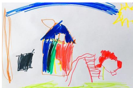
Slika 18. a )