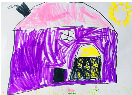
Slika 11. a)