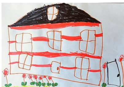
Slika 2. a)

uočava stablo, ali izostavlja tobogan. Međutim, izostavlja tople boje i crta samo oblik vrtića. Možemo vidjeti da dijete crtajući prema promatranju u dvorištu vrtića, više pozornosti daje samom obliku vrtića, a manje bojama. Dijete prvi dan istraživanja (crtanje po sjećaju) izostavlja dosta detalja vezanih uz samu zgradu vrtića. Promatrajući crtež na slici 1.b). vidimo da prikazuje i lošije vrijeme toga dana što je prikazao dodajući više oblaka. Prema hipotezi H-1: Djeca predškolske dobi će izravnim likovnim izražavanjem u prirodnom okruženju oblikovati likovne radove s više realističnih detalja, vidimo da crta realistične detalje u stvarnom prikazu. Slikanjem u prirodi je uočilo i vremenske uvjete toga dana. Prema Boduliću (1982.) pokret, zvuk, miris, svjetlo, boje i oblici izazivaju i zadržavaju dječju pažnju, a drugoga dana slikanja to bi bili manje topliji vremenski uvjeti.