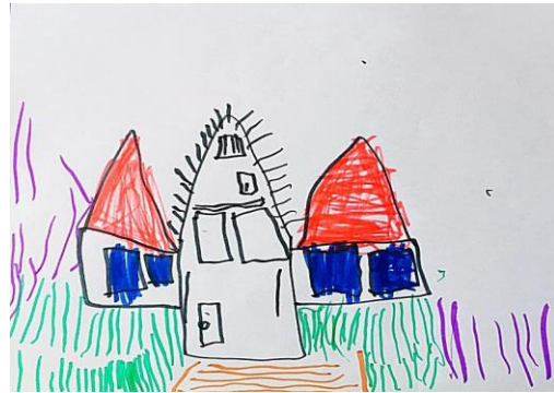
Slika 13. b)

Dijete je na crtežu 13. a) vrtić prikazalo u šarenim bojama, ogradu u crnoj boji te sunce i oblake. Razlog crtanja sunca i oblaka je taj što je ujutro bilo sunce, a poslije se naoblačilo i padala je kiša. Na slici 13.b) dijete predočava vrtić u tri dijela, kakav on zapravo i je. Prema hipotezi H-2: Djeca predškolske dobi će imati potrebu prilagoditi svoje likovne prikaze stvarnom izgledu motiva u prirodnom okruženju. Također možemo vidjeti da dijete više pozornosti pridodaje obliku vrtića, a ne bojama što potvrđuje hipotezu H-1: Djeca predškolske dobi će izravnim likovnim izražavanjem u prirodnom okruženju oblikovati likovne radove s više realističnih detalja.