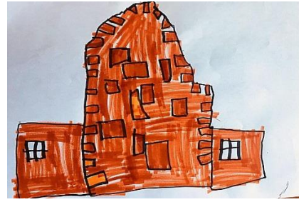
Slika 3. b)

Uspoređujući radove možemo vidjeti da dijete više pažnju usmjerava prema samom izgledu vrtića slikajući prema promatranju. Ono prepoznaje da je vrtić sagrađen od ciglica što jasno vidimo na slici 3.b). Gledajući hipotezu H-2: Djeca predškolske dobi će imati potrebu prilagoditi svoje likovne prikaze stvarnom izgledu motiva u prirodnom okruženju. Dijete crta vrtić sagrađen od ciglica. Tijekom crtanja prema sjećanju više se prisjeća okoliša vrtića, cvijeća i same ograde oko vrtića. Upotrebljava boje koje održavaju neku zatvorenu toplu atmosferu koju podržava nebo i sunce. (Belamarić-Šarčanin,1969:83)