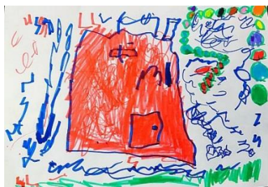
Slika 14. a)