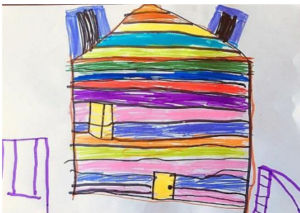
Slika 4. a)

Uspoređujući radove možemo vidjeti da dijete više pažnju usmjerava prema samom izgledu vrtića slikajući prema promatranju. Ono prepoznaje da je vrtić sagrađen od ciglica što jasno vidimo na slici 3.b). Gledajući hipotezu H-2: Djeca predškolske dobi će imati potrebu prilagoditi svoje likovne prikaze stvarnom izgledu motiva u prirodnom okruženju. Dijete crta vrtić sagrađen od ciglica. Tijekom crtanja prema sjećanju više se prisjeća okoliša vrtića, cvijeća i same ograde oko vrtića. Upotrebljava boje koje održavaju neku zatvorenu toplu atmosferu koju podržava nebo i sunce. (Belamarić-Šarčanin,1969:83)