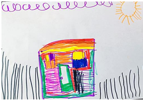
Slika 13. a)

okruženju oblikovati likovne radove s više realističnih detalja, a ujedno i hipoteza H-2: Djeca predškolske dobi će imati potrebu prilagoditi svoje likovne prikaze stvarnom izgledu motiva u prirodnom okruženju.