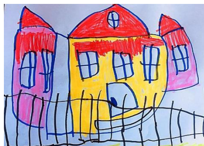
Slika 2. b)

Promatrajući sliku 2. a) vidimo da osim same zgrade vrtića, prikazuje i cvijeće te ljuľačku. Sjetilo se i okruglog prozora koji se inače ne nalazi na prednjem dijelu vrtića. Prikaz cvijeća izostavlja crtajući prema promatranju, zadržava okrugli prozor te dodaje ogradu i jasnije je vidljivije da je zgrada vrtića iz tri dijela. Promatrajući vrtić upotrebljava tople boje u prikazu zidova vrtića. Slikanjem prema promatranju potvrđena je hipoteza H-2: Djeca predškolske dobi će imati potrebu prilagoditi svoje likovne prikaze stvarnom izgledu motiva u prirodnom okruženju.