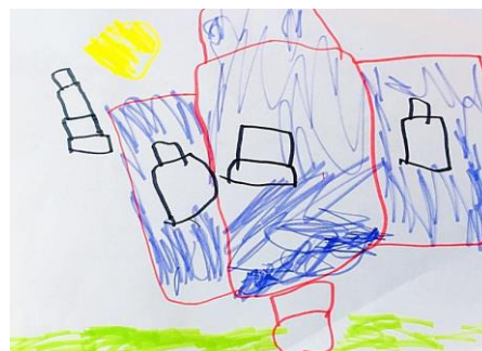
Slika 8. b)

Oba crteža postavljena su u sredini preko cijelog papira. Dječak je na crtežu desno prikazao vrtiću stvarnom obliku, točnije u tri dijela. Jako je važno naglasiti jedan detalj koji je nacrtao, a većina djece ga nije ni uočila, a to su stepenice ( crvenim flomasterom nacrtano na donjem dijelu papira - slika 8.b) Na slici 8.a) dječak je po sjećanju nacrtao ruže što znači da je to njegova asocijacija na vrtić. Njegov rad na slici 8.a) šareniji jer je za vrijeme crtanja po sjećanju bio puno više koncentriraniji, nego kad smo na dvorištu vrtića crtali vrtić po promatranju. Rad je u potpunosti uspješan. Potvrđuje da se djeca znaju dobro izraziti i po sjećanju i po promatranju. Ovaj rad potvrđuje hipotezu H-1: Djeca predškolske dobi će izravnim likovnim izražavanjem u prirodnom okruženju oblikovati likovne radove s više realističnih detalja.