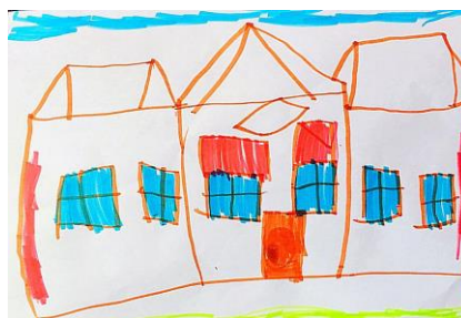
Slika 15. b)

Uspoređujući radove vidimo da je slika 15.a) puno bogatija detaljima za razliku od slike 15.a) Dijete više pažnje pridodaje prvoj slici na kojoj se nalazi cvijeće (2 vrste), sunce, nebo, dimnjak, dok na drugoj slici vidimo stvaran prikaz vrtića u tri dijela. Povezujemo s hipotezom H-1: Djeca predškolske dobi će izravnim likovnim izražavanjem u prirodnom okruženju oblikovati likovne radove s više realističnih detalja, a ujedno i hipoteza H-2: Djeca predškolske dobi će imati potrebu prilagoditi svoje likovne prikaze stvarnom izgledu motiva u prirodnom okruženju. Zanimljivost na slici 15.b) su crvene zavjese koje je dijete nacrtalo. Sitan detalj koji nijedno drugo dijete nije uočilo.