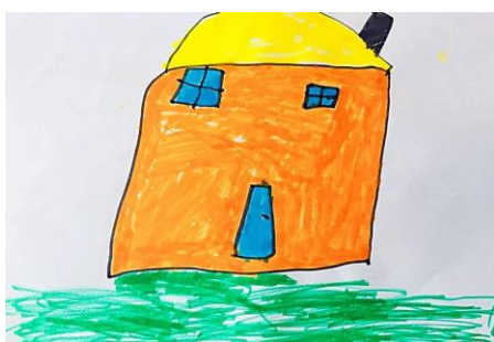
Slika 12. a)

Ovaj crtež jedne djevojčice je jako neobičan. Na prvoj slici vidimo vrtić prikazan na sredini papira u dosta velikoj veličini, a drugi čak preko cijelog papira pa i preko njega. Zanimljivo je to što je ova djevojčica među rijetkima iz svoje grupe nacrtala krug u gornjem dijelu papira i u njemu znak x. Kada sam je pitala što je to ona je odgovorila da je to prozor. Na glavnoj strani vrtića ne postoji takav prozor, ali sa druge strane gdje se djeca najčešće i najviše igraju uistinu ima jedan krug - navodno prozor. Zanimljivo je da se dijete sjeća nečega što je skroz na nevidljivom mjestu te da i prvi i drugi dan nacrtalo isto. Drugi dan kada smo crtali po promatranju ga nije mogla vidjeti, ali izgleda da joj je ostao duboko umemoriran u sjećanju. Na slici 11.a) možemo vidjeti i crvene ruže što znači da je na vrtić asociira cvijeće, odnosno crvene ruže. Ovaj rad potvrđuje hipotezu H-1: Djeca predškolske dobi će izravnim likovnim izražavanjem u prirodnom okruženju oblikovati likovne radove s više realističnih detalja.