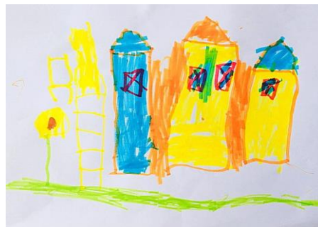
Slika 7. b)

Razlika između ove dvije slike je vidljiva. Na slici lijevo vidimo vrtić prikazan kao jedna građevina, ali na drugoj već vidimo vrtić kako on u stvarnosti izgleda - sastoji se od tri dijela. Na crtežu desno vidimo dva dijela vrtića obojana žutom bojom iz razloga što je taj dio osvijetlilo sunce kada su djeca crtala, a plavi dio je dio vrtića koji je ostao u sjeni (detaljno pažljiv pristup radu). Prema hipotezi H-2: Djeca predškolske dobi će imati potrebu prilagoditi svoje likovne prikaze stvarnom izgledu motiva u prirodnom okruženju. Na oba rada vidimo ružu što i karakterizira sam vrtić. Desna slika (slika crtana po promatranju) prikazuje realan prikaz vrtića ponajprije zbog vrtića koji je nacrtan u tri dijela, pa onda i zbog tobogana koji je nacrtan u stvarnom prostornom dijelu dvorišta. Ovaj rad smatram uspješnim. Ovim radom potvrđena je H-1: Djeca predškolske dobi će izravnim likovnim izražavanjem u prirodnom okruženju oblikovati likovne radove s više realističnih detalja.