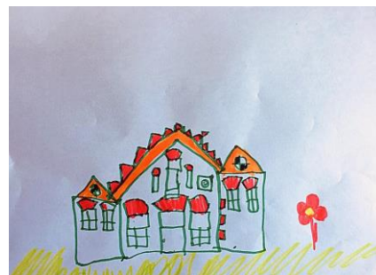
Slika 4. b)

Promatrajući ova dva rada uočavamo razlike u prikazu samoga vrtića. Crtajući prema sjećanju dijete se oslanja na boje te prikaz ljuljačke i tobogana. Crtajući ove detalje i upotrebljavajući toliko različitih boja možemo reći da se više vodilo raspoloženjem koje kod njega izaziva vrtić i sjećanjima kada se igralo u dvorištu. Crtajući prema promatranju daje jasan prikaz zgrade vrtića. Prema H-2: Djeca predškolske dobi će imati potrebu prilagoditi svoje likovne prikaze stvarnom izgledu motiva u prirodnom okruženju. Prikazuje kako su raspoređeni prozori na vrtiću, krov vrtića te sami oblik zgrade vrtića. Boje izostaju u prikazu jer je ono pažnju usmjerilo na sami oblik vrtića, a ne i prostor oko vrtića.