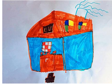
Slika 5. b)

Prvi crtež prikazuje dječju razigranost bojama. Ono crta tobogan, ljuljačke, cvijeće i sve što se u tome trenutku moglo prisjetiti da se nalazi oko njegova vrtića. Pozornost više daje samom dvorištu vrtića, nego zgradi. Crtajući prema promatranju izostavlja prikaz prostora oko vrtića i usmjerava se samo prema zgradi vrtića. Dijete izostavlja više detalja tijekom crtanja prema promatranju vezanih za prostor okolo vrtića, ali više detalja upotrebljava na samoj zgradi vrtića. Prema promatranju možemo reći da realnije prikazuje vrtić, ali da je prvi rad ispunjen s više detalja i da iz njega vidimo da dijete se dobro osjeća u vrtiću. Međutim, realni prikaz vrtića učenik crta nalazeći se u prirodnome okruženju vrtića. Donosi realističniji motiv vrtića. Ovime radom potvrđuje se H-1: Djeca predškolske dobi će izravnim likovnim izražavanjem u prirodnom okruženju oblikovati likovne radove s više realističnih detalja.