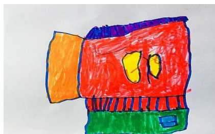
Slika 14. b)

Na prvoj slici dijete je prikazalo vrtić po sjećanju iz čega vidimo kako on zapravo vidi svoj boravak tamo. Kako je opisao, sve oko vrtića su igračke. Od svega najviše voli dvorište jer se tamo ljuđa, klacka, penje, vrti. To je sve predočio na slici 14. a). Slika 14. b) prikazuje također vrtić, ali u istraživanju po promatranju nije toliko prikazao igru. Prikazao je dva dijela vrtića, precizno iscrtane boje, ogradu, dva prozora te stepenice i zbog toga ovaj rad potvrđuje hipotezu H-1: Djeca predškolske dobi će izravnim likovnim izražavanjem u prirodnom okruženju oblikovati likovne radove s više realističnih detalja