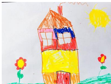
Slika 10. a)

bojanju dok na desnoj slici detaljima (trava, ruže, cigle). Dječji rad potvrđuje hipotezu H-1: Djeca predškolske dobi će izravnim likovnim izražavanjem u prirodnom okruženju oblikovati likovne radove s više realističnih detalja, a ujedno i hipotezu H-2: Djeca predškolske dobi će imati potrebu prilagoditi svoje likovne prikaze stvarnom izgledu motiva u prirodnom okruženju.