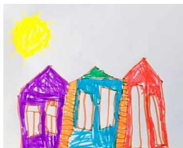
Slika 10. b)

Slika 10.a) prikazuje vrtić kao veliku, visoku građevinu, a razlog tome je što je dijete mislilo da je zbog stepenica vrtić na katu. U razgovoru o stvarnom prikazu i trenutnom viđenju vrtića, dječak je nacrtao tri dijela vrtića, kakav on zaista i je. Na slici 10.a) vidimo i cvijet ružu koje dijete asocira na vrtić. Na slici vidimo i dimnjak koje je u trenutku sjećanja dijete pomislilo da dimnjak zapravo i postoji (no promatranjem na drugi dan istraživanja utvrdili smo da dimnjaka nema). Slika 10.b) prikazuje i nacrtane cigle vrtića u stvarnom okruženju. Analizirajući drugi rad potvrđuju se obje hipoteze H-1: Djeca predškolske dobi će izravnim likovnim izražavanjem u prirodnom okruženju oblikovati likovne radove s više realističnih detalja, a ujedno i hipoteza H-2: Djeca predškolske dobi će imati potrebu prilagoditi svoje likovne prikaze stvarnom izgledu motiva u prirodnom okruženju.