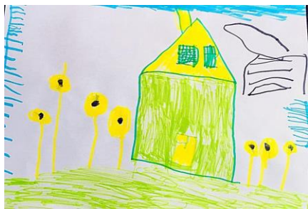
Slika 16. a)