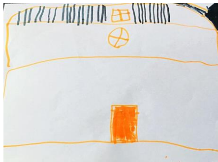
Slika 11. b)

Ovaj crtež jedne djevojčice je jako neobičan. Na prvoj slici vidimo vrtić prikazan na sredini papira u dosta velikoj veličini, a drugi čak preko cijelog papira pa i preko njega. Zanimljivo je to što je ova djevojčica među rijetkima iz svoje grupe nacrtala krug u gornjem dijelu papira i u njemu znak x. Kada sam je pitala što je to ona je odgovorila da je to prozor. Na glavnoj strani vrtića ne postoji takav prozor, ali sa druge strane gdje se djeca najčešće i najviše igraju uistinu ima jedan krug - navodno prozor. Zanimljivo je da se dijete sjeća nečega što je skroz na nevidljivom mjestu te da i prvi i drugi dan nacrtalo isto. Drugi dan kada smo crtali po promatranju ga nije mogla vidjeti, ali izgleda da joj je ostao duboko umemoriran u sjećanju. Na slici 11.a) možemo vidjeti i crvene ruže što znači da je na vrtić asociira cvijeće, odnosno crvene ruže. Ovaj rad potvrđuje hipotezu H-1: Djeca predškolske dobi će izravnim likovnim izražavanjem u prirodnom okruženju oblikovati likovne radove s više realističnih detalja.