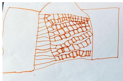
Slika 19. b)

Na prvom crtežu 19. a) vidimo svijetlom bojom obojan vrtić što u njoj izaziva ugodu i mir. Plavi dio krova predstavlja kišu koja je padala dok su djeca crtala. Broj prozora je pažljivo određen i ponovljen u drugom redu. Druga slika 19. b) predstavlja vrtić u tri dijela - točno onako kakav i je. Isto tako djevojčica je pokušala napraviti sve od sitnih ciglica, no pred kraj se umorila. Dječji rad potvrđuje H-2: Djeca predškolske dobi će imati potrebu prilagoditi svoje likovne prikaze stvarnom izgledu motiva u prirodnom okruženju.