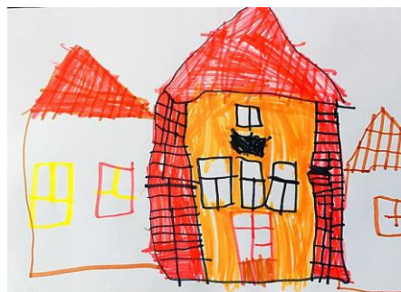
Slika 17. b)

Dijete je na slici 17. a) nacrtalo dosta detalja, a to su: žuto sunce, crveni tobogan, crveno cvijeće, crnu klupu, zelenu travu, plavo nebo, tamno zeleni dimnjak. Laganu narančastu boju pridodaje samom vrtiću uz jaku crnu boju krova. Na slici 17. b) svi ti detalji nestaju, a od jedne građevine nastaje veća građevina tj. vrtić sastavljen od tri dijela. Na vrtiću od tri dijela uočavamo jako dobro iscrtane linije koje predstavljaju cigle. Dijete pri promatranju više obraća pažnju na iscrtavanje i strukturu rada nego na bojanje što ovaj rad potvrđuje hipoteza H-1: Djeca predškolske dobi će izravnim likovnim izražavanjem u prirodnom okruženju oblikovati likovne radove s više realističnih detalja, a ujedno i hipoteza H-2: Djeca predškolske dobi će imati potrebu prilagoditi svoje likovne prikaze stvarnom izgledu motiva u prirodnom okruženju.