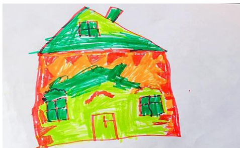
Slika 16. b)

Na crtežu 16.a) vidimo dosta detalja s kojima dijete prikazuje svoje sjećanje o tome kako njegov vrtić izgleda. Boja je vrtića prikazana vedrom zelenom bojom, cvjetovi žutom bojom, a nebo i kiša plavom bojom. Crtež pod 16.b) nije promijenio strukturu, točnije dijete nije nacrtalo pravu realnu strukturu vrtića, kao što su i ostala djeca (zapravo kako vrtić i izgleda). Ovo je jedini crtež koji nije koji nije ispunio zadatak realnog viđenja strukture vrtića, iako se cigle lagano nadziru na slici 16.b). Ovaj rad ne potvrđuje niti jednu tvrdnju hipoteze.