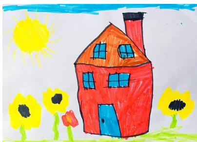
Slika 15. a)

Na prvoj slici dijete je prikazalo vrtić po sjećanju iz čega vidimo kako on zapravo vidi svoj boravak tamo. Kako je opisao, sve oko vrtića su igračke. Od svega najviše voli dvorište jer se tamo ljuđa, klacka, penje, vrti. To je sve predočio na slici 14. a). Slika 14. b) prikazuje također vrtić, ali u istraživanju po promatranju nije toliko prikazao igru. Prikazao je dva dijela vrtića, precizno iscrtane boje, ogradu, dva prozora te stepenice i zbog toga ovaj rad potvrđuje hipotezu H-1: Djeca predškolske dobi će izravnim likovnim izražavanjem u prirodnom okruženju oblikovati likovne radove s više realističnih detalja