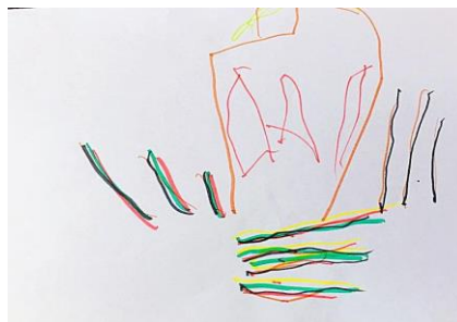
Slika 18. b)

Dijete na crtežu 18. a) prikazuje svoj vrtić više tamnim nego svijetlim bojama-jedino su vrata naznačena žutom bojom i pola zida crvenom bojom. Uz to, nacrtalo je nebo i sunce iz razloga što je dan bio pola sunčan, a pola dana je padala kiša. Pokraj vrtića crta i crveni tobogan, crveni cvijet, crnu klupu, zelenu travu i napola dovršeno smeđe drvo hipoteza H-1: Djeca predškolske dobi će izravnim likovnim izražavanjem u prirodnom okruženju oblikovati likovne radove s više realističnih detalja. Drugi dan crtajući prema promatranju dječak je brzo odustao te jedino što je nacrtao su obrisi vrtića (bez ostala dva dijela), stepenice i šarena ograda. Jedina stvar koju je dječak nadodao u crtežu stepenice, ograda i tri prozora na vrtiću te zbog toga u ovome radu hipoteza h-2 je opovrgnuta.