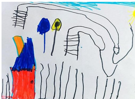
Slika 6. a)

Prvi crtež prikazuje dječju razigranost bojama. Ono crta tobogan, ljuljačke, cvijeće i sve što se u tome trenutku moglo prisjetiti da se nalazi oko njegova vrtića. Pozornost više daje samom dvorištu vrtića, nego zgradi. Crtajući prema promatranju izostavlja prikaz prostora oko vrtića i usmjerava se samo prema zgradi vrtića. Dijete izostavlja više detalja tijekom crtanja prema promatranju vezanih za prostor okolo vrtića, ali više detalja upotrebljava na samoj zgradi vrtića. Prema promatranju možemo reći da realnije prikazuje vrtić, ali da je prvi rad ispunjen s više detalja i da iz njega vidimo da dijete se dobro osjeća u vrtiću. Međutim, realni prikaz vrtića učenik crta nalazeći se u prirodnome okruženju vrtića. Donosi realističniji motiv vrtića. Ovime radom potvrđuje se H-1: Djeca predškolske dobi će izravnim likovnim izražavanjem u prirodnom okruženju oblikovati likovne radove s više realističnih detalja.