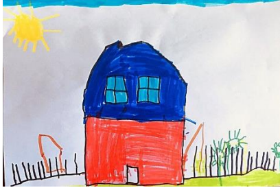
Slika 3. a)