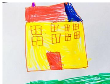
Slika 19. a)

Dijete na crtežu 18. a) prikazuje svoj vrtić više tamnim nego svijetlim bojama-jedino su vrata naznačena žutom bojom i pola zida crvenom bojom. Uz to, nacrtalo je nebo i sunce iz razloga što je dan bio pola sunčan, a pola dana je padala kiša. Pokraj vrtića crta i crveni tobogan, crveni cvijet, crnu klupu, zelenu travu i napola dovršeno smeđe drvo hipoteza H-1: Djeca predškolske dobi će izravnim likovnim izražavanjem u prirodnom okruženju oblikovati likovne radove s više realističnih detalja. Drugi dan crtajući prema promatranju dječak je brzo odustao te jedino što je nacrtao su obrisi vrtića (bez ostala dva dijela), stepenice i šarena ograda. Jedina stvar koju je dječak nadodao u crtežu stepenice, ograda i tri prozora na vrtiću te zbog toga u ovome radu hipoteza h-2 je opovrgnuta.