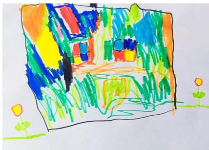
Slika 8. a)