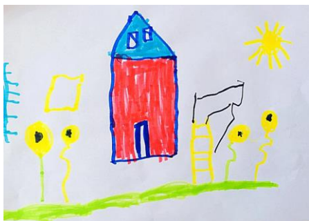
Slika 7. a)

dječaka je više zanimala igra (klackanje, trčanje) nego likovna aktivnost. Dječak je ipak odradio više nego dovoljno zbog toga što je na papiru lijevo nacrtao samo jedan dio vrtića, a na radu desno dva dijela od ukupno tri. Nacrtao je i prozore koji na crtežu lijevo nisu prikazani. Rad prikazuje dječja iskrenost pri viđenju onoga što oni vole u vrtiću. Ovaj rad potvrđuje hipotezu H-1: Djeca predškolske dobi će izravnim likovnim izražavanjem u prirodnom okruženju oblikovati likovne radove s više realističnih detalja.