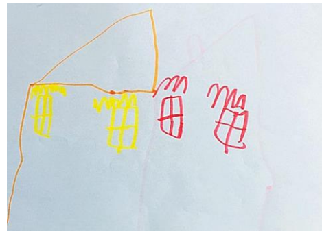
Slika 6. b)

Na slici je 6.a) predložen vrtić na jednoj trećini papira a ostali dio papira zauzimaju sprave za djecu (tobogani) te dva balona. Ovaj dječak se vodio onim što njega zanima te onim što najviše voli u vrtiću - a to su zabava i igranje. Na crtežu koji prikazuje vrtić pri promatranju, dječak je bio dekoncentriran i nezainteresiran za crtanje. Budući da je istraživanje provedeno u dvorištu vrtića,