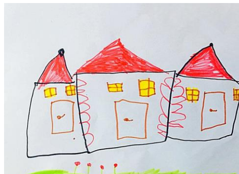
Slika 9. b)

Ovi radovi prikazuju razliku u sastavnici vrtića gdje slika 9.a) prikazuje jedan dio vrtića, a slika 9.b) sva tri dijela vrtića - što je pozitivno jer se na slici desno prikazuje vrtić u stvarnom izgledu. Slika 1.b prikazuje vrtić u ciglama (od čega ustvari on i je napravljen) točnije, djevojčica je uočila izbočine na samom zidu vrtića - što nam govori da izražavanje djece pri promatranju donosi detalje koje se u procesu izražavanja pri sjećanju ne vide. Na lijevoj slici je dijete pridodalo više pažnje