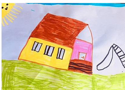
Slika 1. a)