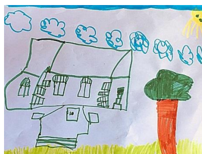
Slika 1. b)

Dijete je na crtežu “Slika 1.a” nacrtalo vrtić u toplim bojama, tobogan te sunce. Vidimo da vrtić prikazuje kao građevinu iz jednoga dijela, iako je u stvarnome prikaz iz tri dijela. Na slici 1.b primjećuje da je vrtić iz tri dijela, crta ciglice kao detalj iznad prozora i po ćoškovima vrtića,