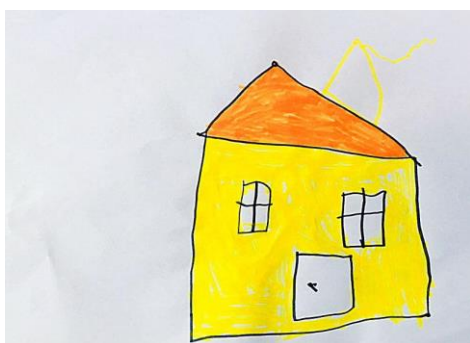
Slika 9. a)

Oba crteža postavljena su u sredini preko cijelog papira. Dječak je na crtežu desno prikazao vrtiću stvarnom obliku, točnije u tri dijela. Jako je važno naglasiti jedan detalj koji je nacrtao, a većina djece ga nije ni uočila, a to su stepenice ( crvenim flomasterom nacrtano na donjem dijelu papira - slika 8.b) Na slici 8.a) dječak je po sjećanju nacrtao ruže što znači da je to njegova asocijacija na vrtić. Njegov rad na slici 8.a) šareniji jer je za vrijeme crtanja po sjećanju bio puno više koncentriraniji, nego kad smo na dvorištu vrtića crtali vrtić po promatranju. Rad je u potpunosti uspješan. Potvrđuje da se djeca znaju dobro izraziti i po sjećanju i po promatranju. Ovaj rad potvrđuje hipotezu H-1: Djeca predškolske dobi će izravnim likovnim izražavanjem u prirodnom okruženju oblikovati likovne radove s više realističnih detalja.