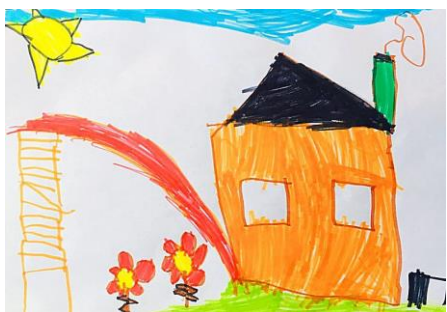
Slika 17. a)

Na crtežu 16.a) vidimo dosta detalja s kojima dijete prikazuje svoje sjećanje o tome kako njegov vrtić izgleda. Boja je vrtića prikazana vedrom zelenom bojom, cvjetovi žutom bojom, a nebo i kiša plavom bojom. Crtež pod 16.b) nije promijenio strukturu, točnije dijete nije nacrtalo pravu realnu strukturu vrtića, kao što su i ostala djeca (zapravo kako vrtić i izgleda). Ovo je jedini crtež koji nije koji nije ispunio zadatak realnog viđenja strukture vrtića, iako se cigle lagano nadziru na slici 16.b). Ovaj rad ne potvrđuje niti jednu tvrdnju hipoteze.