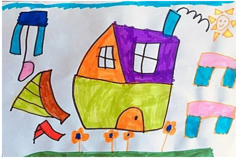
Slika 5. a)