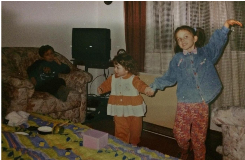
Slika 7. Autoričina plesna improvizacija, 1999.

To ne znači da se ove igre ne mogu izvoditi u obliku kruga ili kolone. Odgojitelj je rukovoditelj igara i ne smije kočiti raspoloženje djece ali određuje u kojem će smjeru igra otići i može je prekinuti ako npr. postoji opasnost od ozljeda pri lovljenju. U dva ili više osnovnih oblika kao što je kolo, kolona uz slobodne pokrete i sl., izvode se igre mješovitih oblika. Ove igre obuhvaćaju sadržaje koji se odnose na živa bića, životinje, nežive predmete ili ljude. Jednostavne riječi, jednostavni pokreti i jednostavna izražajna sredstva glazbe primjenjuju se u igrama mješovitih oblika (Manasteriotti 1981).