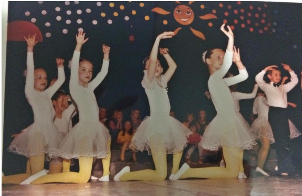
Slika 6. Koreografija „Visibabe“ koja sadrži složenije plesne pokrete, Brodski leptirići 2001.

Ako su plesni pokreti glavne uloge složeniji i zahtijevaju uvježbavanje, treba raditi planski i u tjelesnome i u glazbenome odgoju. Specifičnosti ovih igara su ritmički hod u koloni ili vrsti, održavanje ravnoteže na prijelazu iz skoka u stojeći stav. Treba paziti da se djeca uspravno drže, da izvršavaju svoje zadatke, poštuju pravila i usklade početak i svršetak određenog pokreta s pjevanjem ili glazbom (Manasteriotti 1981).