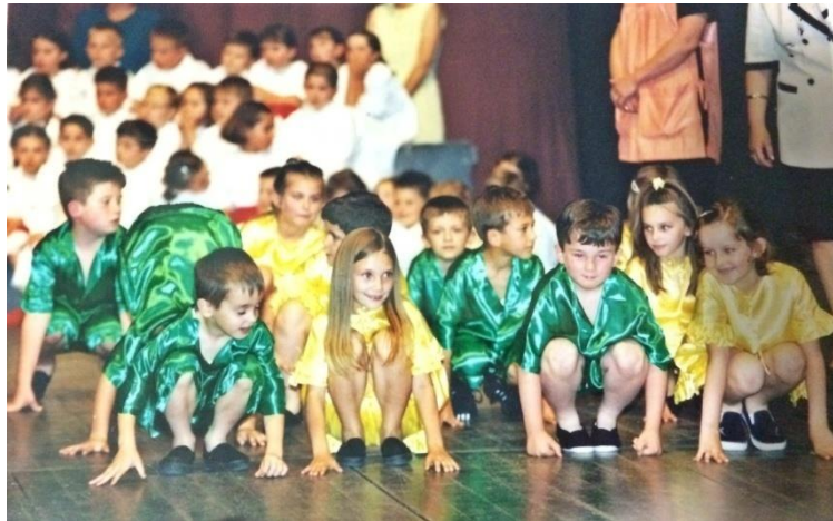
Slika 2. Ples kroz igru, završna priredba vrtića „Seka i braco“, Slavonski Brod, 2001.

Dijete u predškolskoj dobi provodi gotovo cijeli dan igrajući se. Igrom zadovoljava sve svoje životne funkcije. Uz pomoć igre razvija se motorika koja je važna za plesne strukture djeteta, bez koje dijete ne može učiti niti usvojiti plesne pokrete. Plešući, dijete također održava i razvija svoje motoričke kao i intelektualne funkcije. Ples ima utjecaj na razvoj socijalnih vještina, oblikuje prosocijalnu osobu i pomaže pri emocionalnom sazrijevanju djeteta (Goran i Marić 1991).