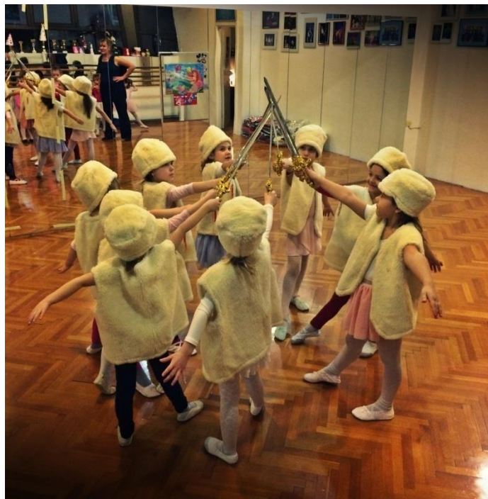
Slika 1. Ples s borbenim motivima – „Ples sa sabljama“, Brodski leptirići 2018., arhiva autorice.

U arhetipove plesova ne ubrajamo spontane plesne manifestacije koje možemo naći kod djece. Takvi plesni pokreti i koreografije nastaju iz potrebe za ritmičkim gibanjem ili za oslobađanjem jakih emocija ili viška energije (Maletić 2002).