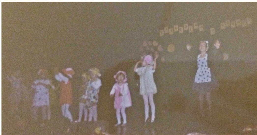
Slika 4. Dječja igra s pjevanjem koja uključuje plesne pokrete, koreografija „Bebe“, Brodski leptirići u Kazališno koncertnoj dvorani „Ivana Brlić-Mažuranić“, Slavonski Brod 1999., arhiva autorice.