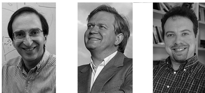
Slika 1. Dobitnici Nobelove nagrade iz fizike za 2011. godinu, Saul Perlmutter (lijevo), Brian P. Schmidt (u sredini) i Adam G. Riess (desno). Perlmutter (r. 1959. god.) je profesor astrofizike na University of California u Berkeleyu. Schmidt (r. 1967. god.) profesor je na Australian National University u Weston Creeku, a Riess (r. 1969. god.) je profesor astronomije i fizike na Johns Hopkins University i Space Telescope Science Institute u Baltimoreu.

Početak i kraj 20. stoljeća u kozmologiji je obilježen velikim otkrićima. Velika pak otkrića u početku najčešće još nemaju objašnjenje. Kada je Vesto Sliipher 1913. godine objavio otkriće crvenog pomaka u spektrima spiralnih maglica, niti prava priroda spiralnih maglica još nije bila otkrivena. Na samom kraju stoljeća, a ujedno i milenija, 1998. godine, otkriće ubrzanog širenja Svemira promijenit će kozmološku paradigmu – umjesto gravitacijske sile Svemirom vlada tamna energija čije je porijeklo, unatoč intenzivnim istraživanjima proteklih desetak godina, još uvijek nepoznato.