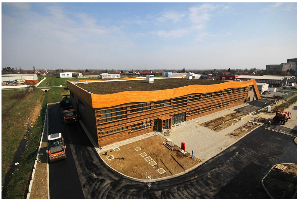
Sl.4. Panonski drveni centar kompetencija