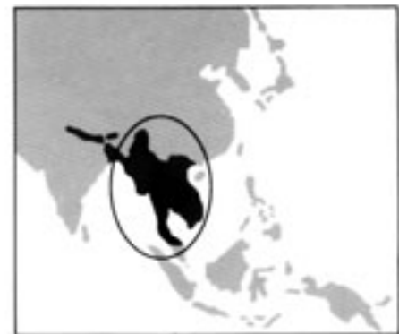
PNB habitant inférieur à 230 $US