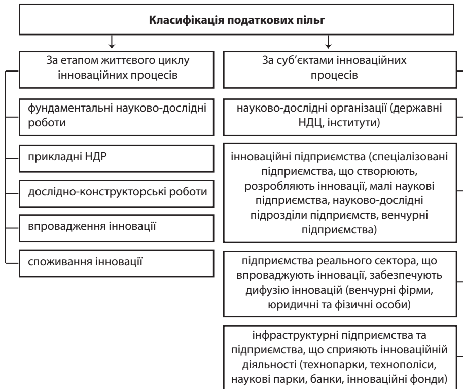
Рис. 1. Запропоновані автором класифікаційні ознаки податкових інструментів стимулювання інноваційної діяльності