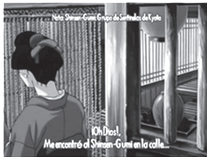
FIGURA 2 USO DE NOTAS ACLARATORIAS EN LA PARTE SUPERIOR DE LA PANTALLA