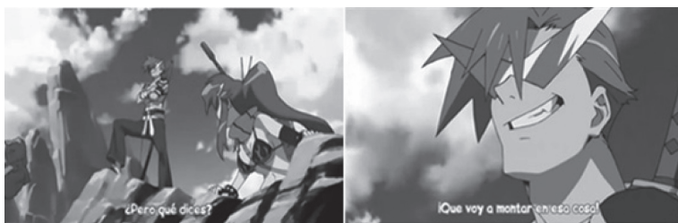
FIGURA 1 USO DE TIPOS DE LETRAS “NO CONVENCIONALES”