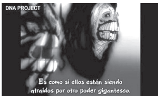
FIGURA 4 SUBTÍTULOS ANGLICADOS

profesional en general, pues no es infrecuente que en este ámbito se encargue la traducción de un texto que ya es en sí una traducción, escrito en otra lengua—. Esto puede notarse en el siguiente ejemplo, ofrecido también por Martínez García, que corresponde a la subtitulación que hizo el grupo DNA Project 13 del episodio 295 de la serie Bleach (Sogo & Abe, 2010).