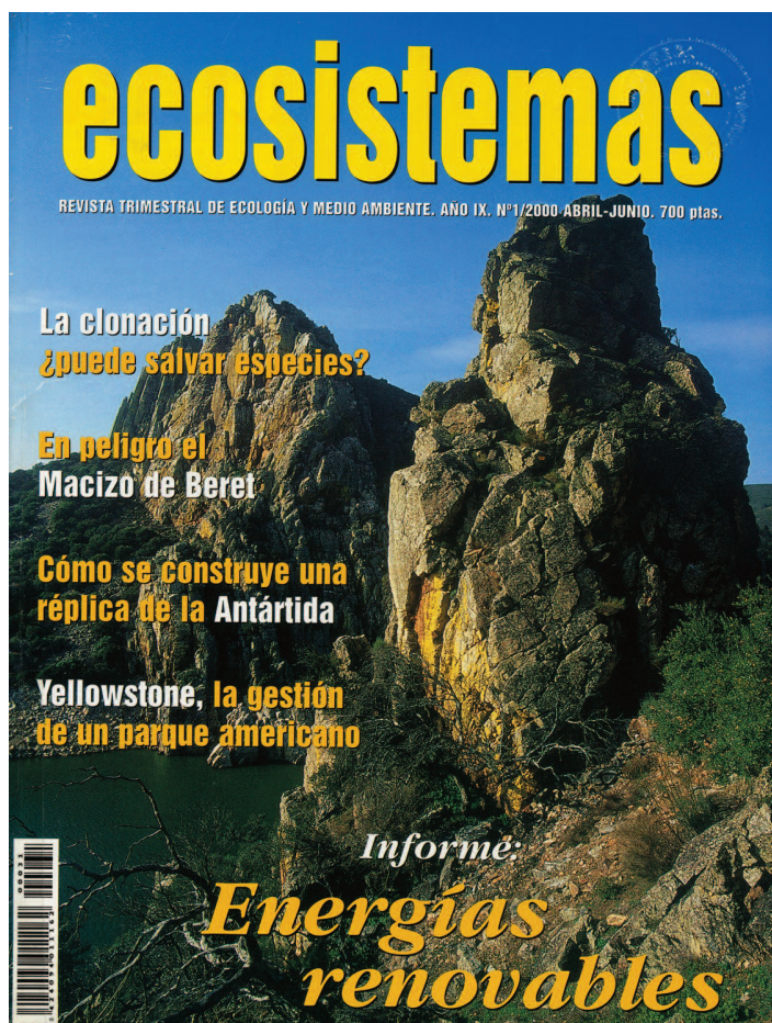
Figura 2. Portada del último número publicado en papel de la revista Ecosistemas , en Abril-Junio de 2000.

Como se puede ver en esta figura, el porcentaje de contribuciones de carácter científico va aumentando de forma progresiva desde el 30% en el año 2001 hasta algo más del 80% en el año 2012. Al contrario de lo que ocurre con las contribuciones de carácter científico, las contribuciones de carácter técnico y divulgativo que se han publicado en la revista, han ido disminuyendo de forma progresiva a lo largo de estos años. Algunos tipos de contribuciones, como las entrevistas, los artículos de opinión o los artículos sobre la ecología de especies o resúmenes de proyectos o actividades relacionados con la educación ambiental, desaparecen por completo de la línea editorial de la revista en los últimos años, sin que haya un reflejo de estos cambios en la política editorial. Esta evolución posiblemente refleja el cambio en los intereses de los propios lectores, que a menudo también son los autores de los artículos publicados. Aunque las secciones tienen mucha variabilidad en cuanto a la naturaleza de sus contenidos, creemos que este análisis somero puede servir como una aproximación que ilustra bastante bien la evolución de la revista en la última década. Con base en sus contenidos podemos decir que Ecosistemas se ha convertido, por tanto, en los últimos años una revista eminentemente científica.