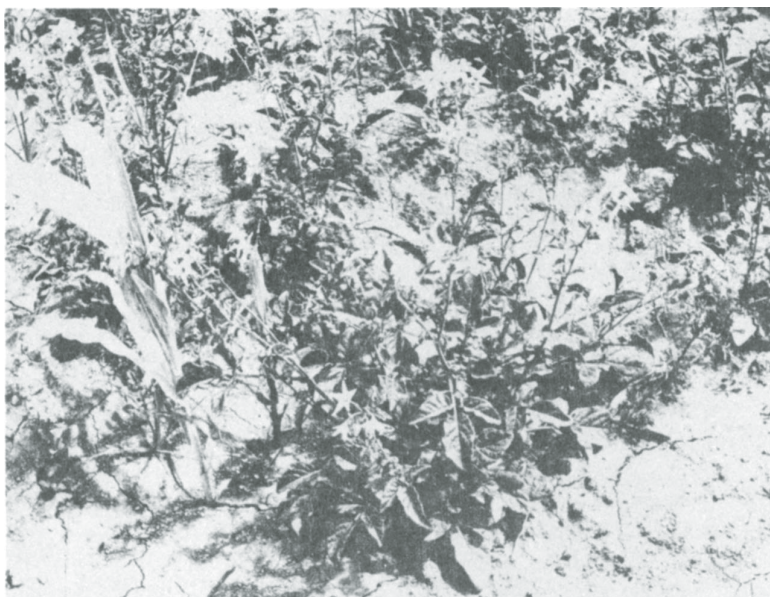
Fig. 4. Plantas de papita de monte auspiadas en un cultivo de maíz.

mentos de trabajo, y c) los tubérculos que llegan a quedar expuestos fuera de la temporada recolección, son enterrados por los agricultores para su posterior desarrollo.