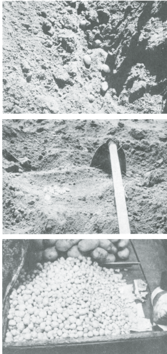
Fig 3. Obtención y comercio de tubérculos de papita de monte.