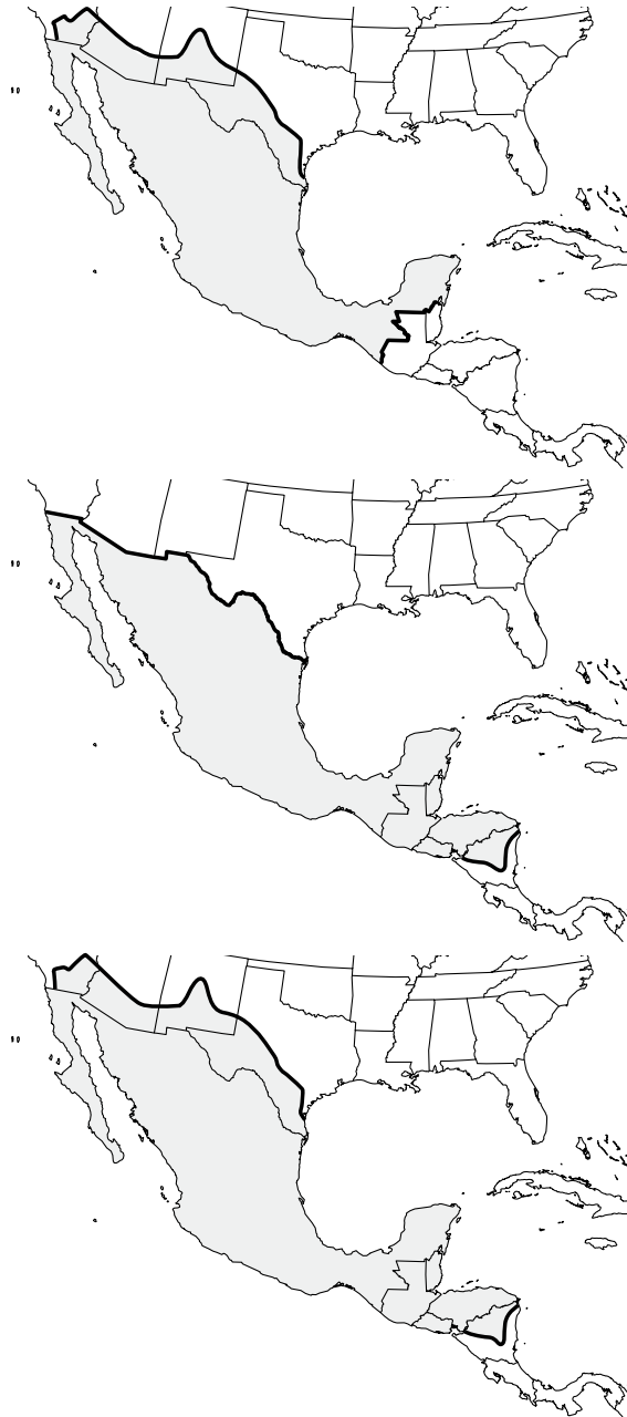
Fig. 2. Megaméxico. De arriba hacia abajo: Megaméxico 1, Megaméxico 2 y Megaméxico 3, de acuerdo con el trabajo de Rzedowski (1991a).