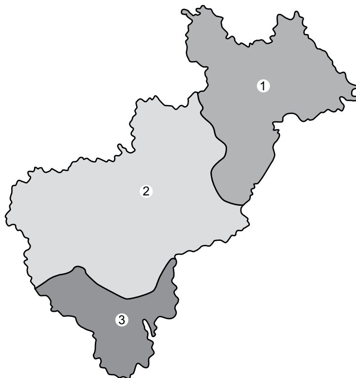
Fig. 1. Regiones fisiográficas del estado de Querétaro. 1. Sierra Madre Oriental. 2. Altiplanicie Mexicana. 3. Eje Volcánico Transversal.

Para una definición más amplia y detallada de los aspectos ambientales, así como de las características de la flora y de la vegetación del estado, cabe consultar el trabajo de Zamudio et al. (1992).