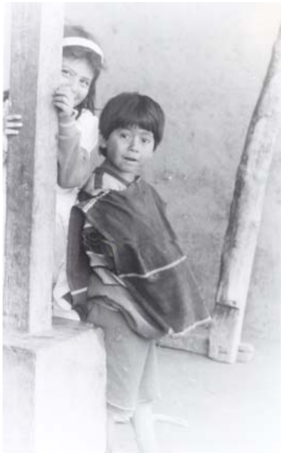
RESGUARDO DE GUAMBIA, 1991

Hábitat transitorio y vivienda para emergencias