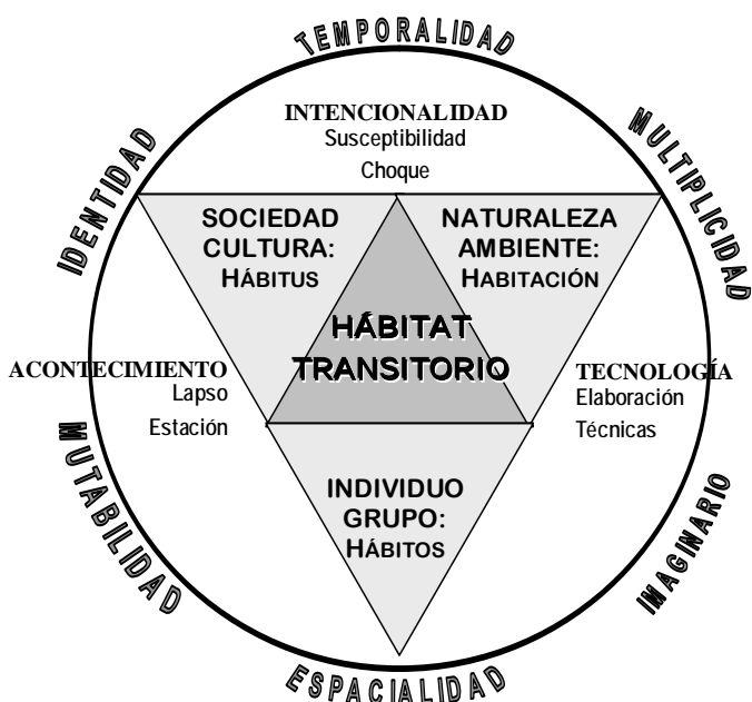
Gráfico 01. Interpretación del Hábitat Transitorio

De acuerdo con Rubén Pesci «el ambiente no es; se hace» suponiendo cambios y desafíos, movimientos e interpretaciones vitales, para todas las especies (2000: 125). Si examinamos la relación hábitat-transitoriedad, podemos anticipar esta modificación de los comportamientos en los habitantes de un ambiente –léase hábitat- según el medio físico transitorio en el que suceden y sobre el cual, Amos Rapoport ya había sentenciado: